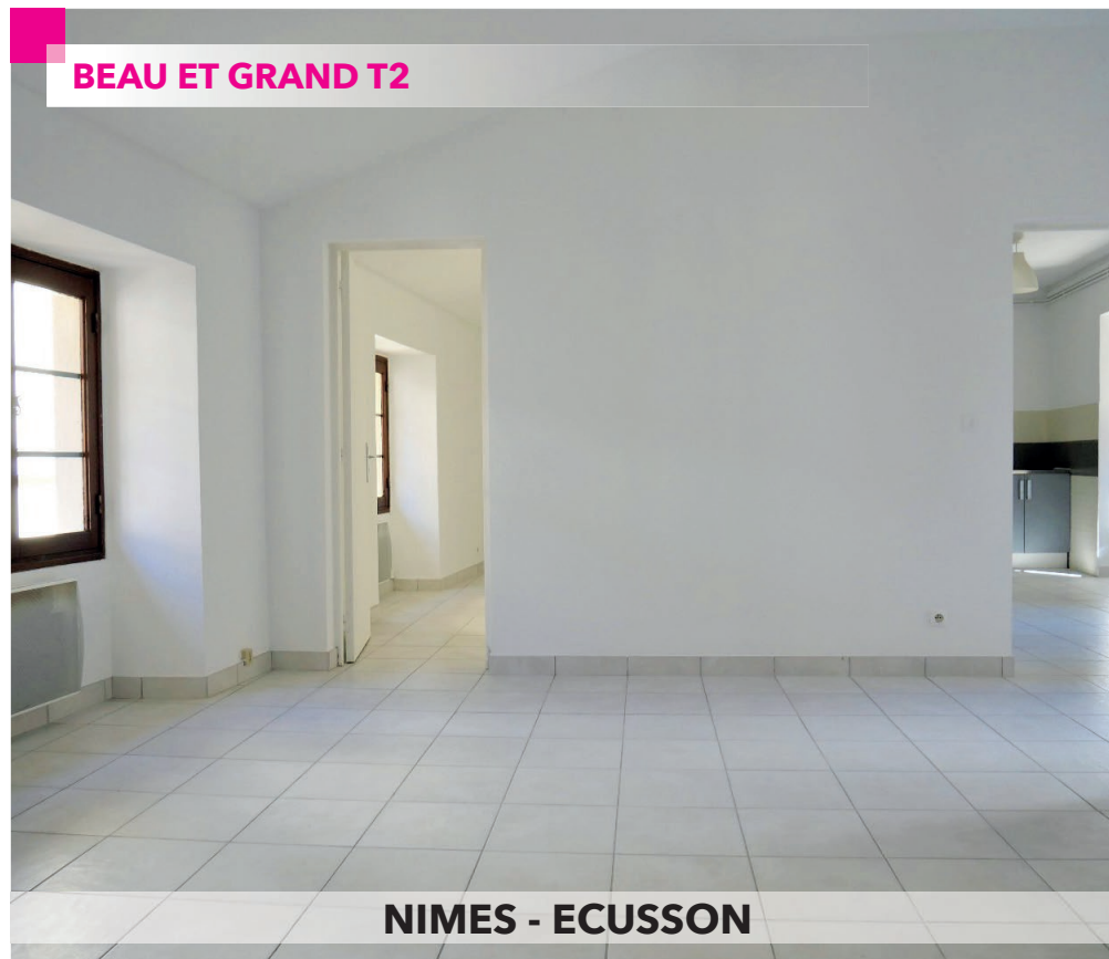
NIMES - ECUSSON