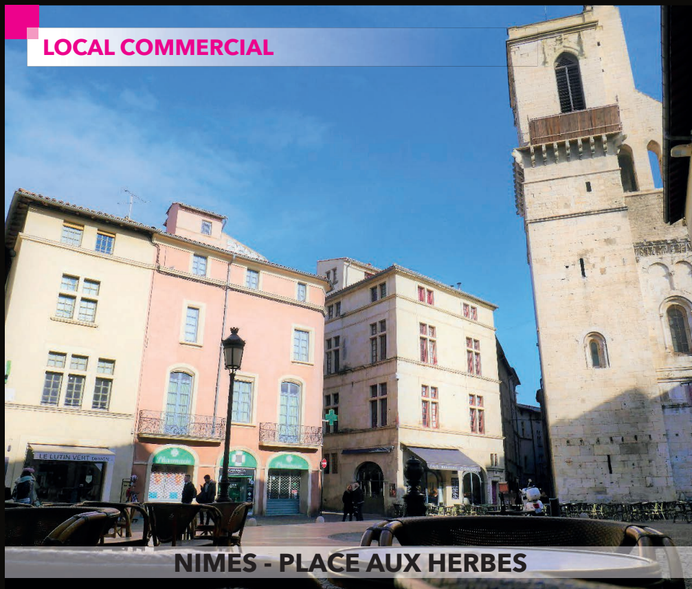
NIMES - PLACE AUX HERBES