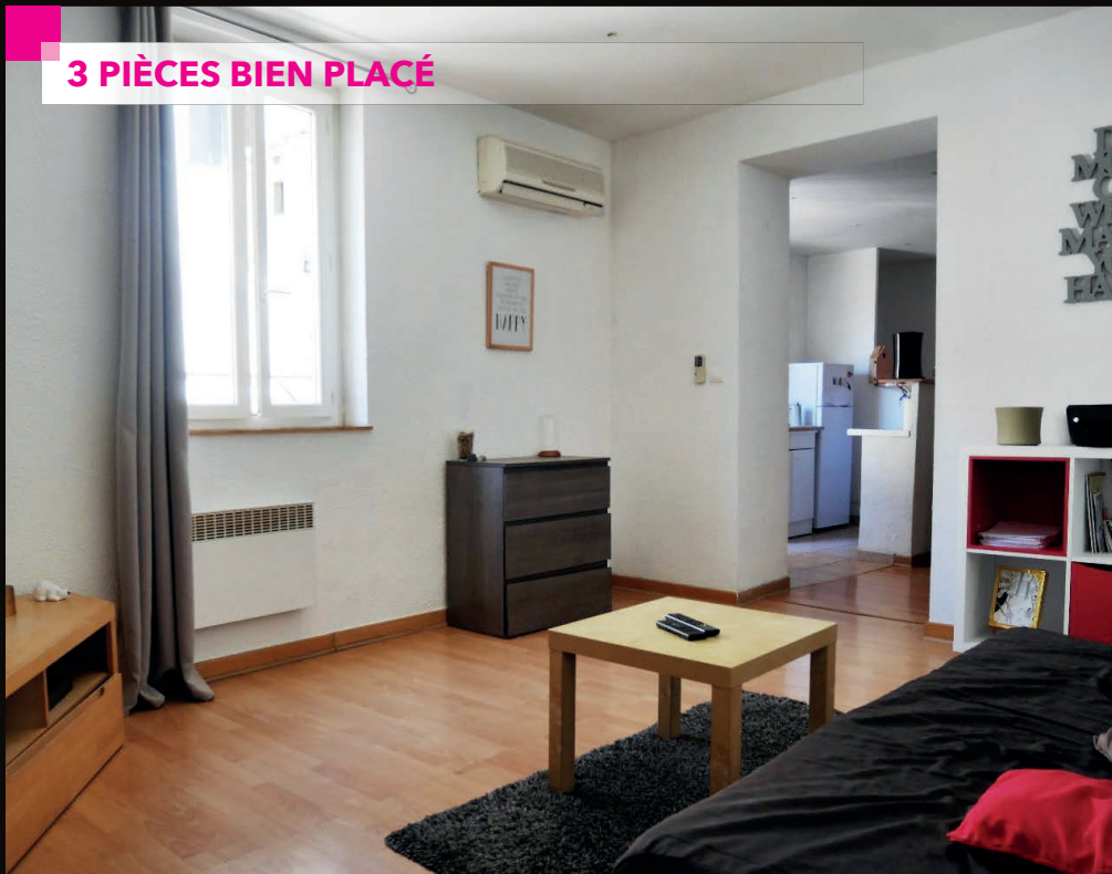
NIMES - ECUSSON