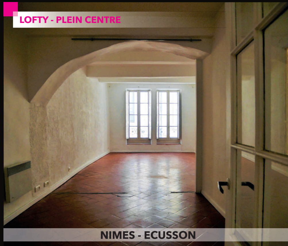
NIMES - ECUSSON