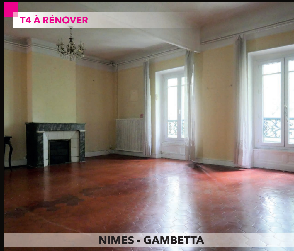
NIMES - GAMBETTA