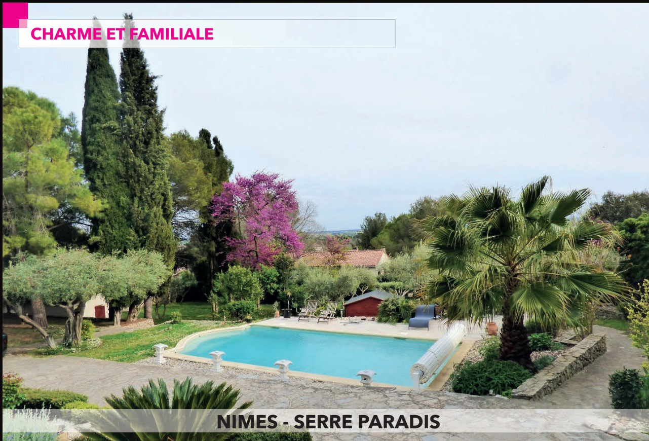
NIMES - SERRE PARADIS