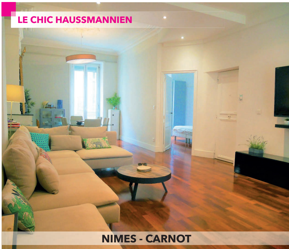
NIMES - CARNOT