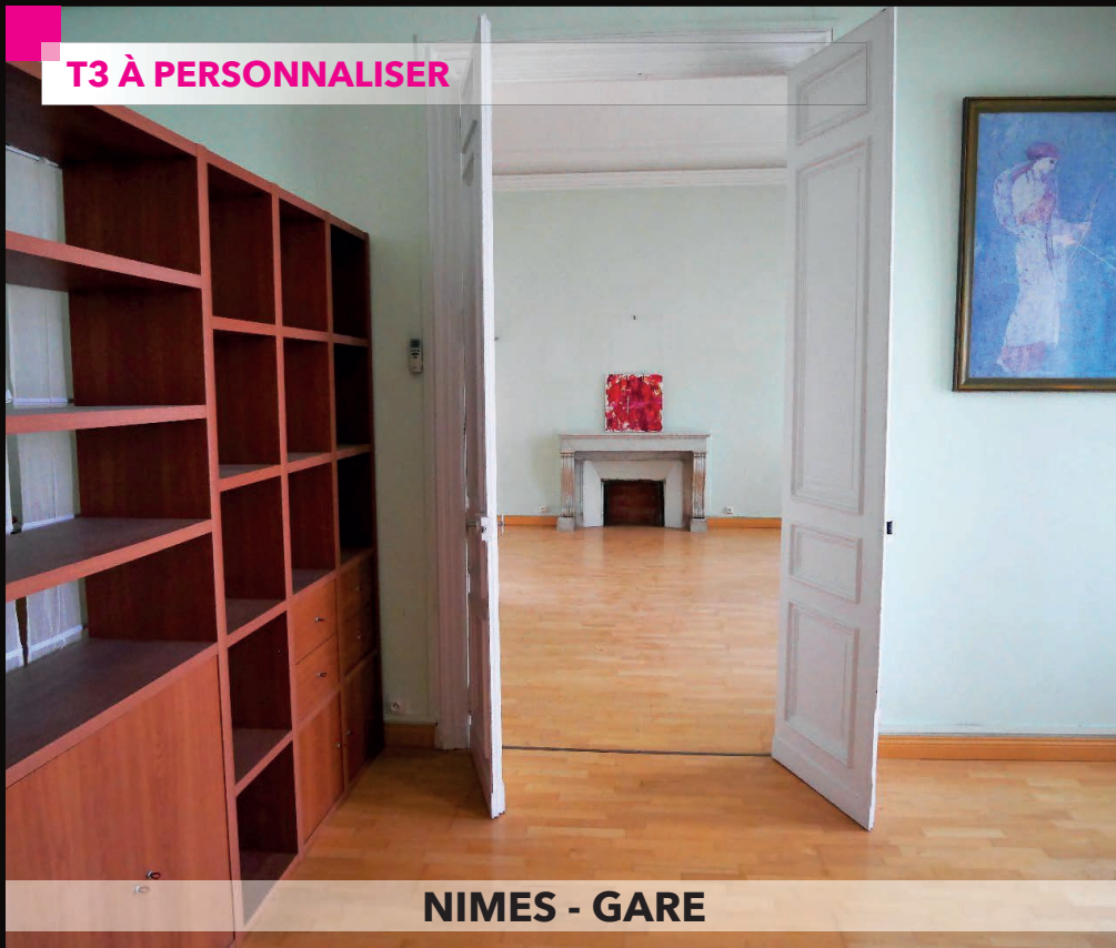
NIMES - GARE