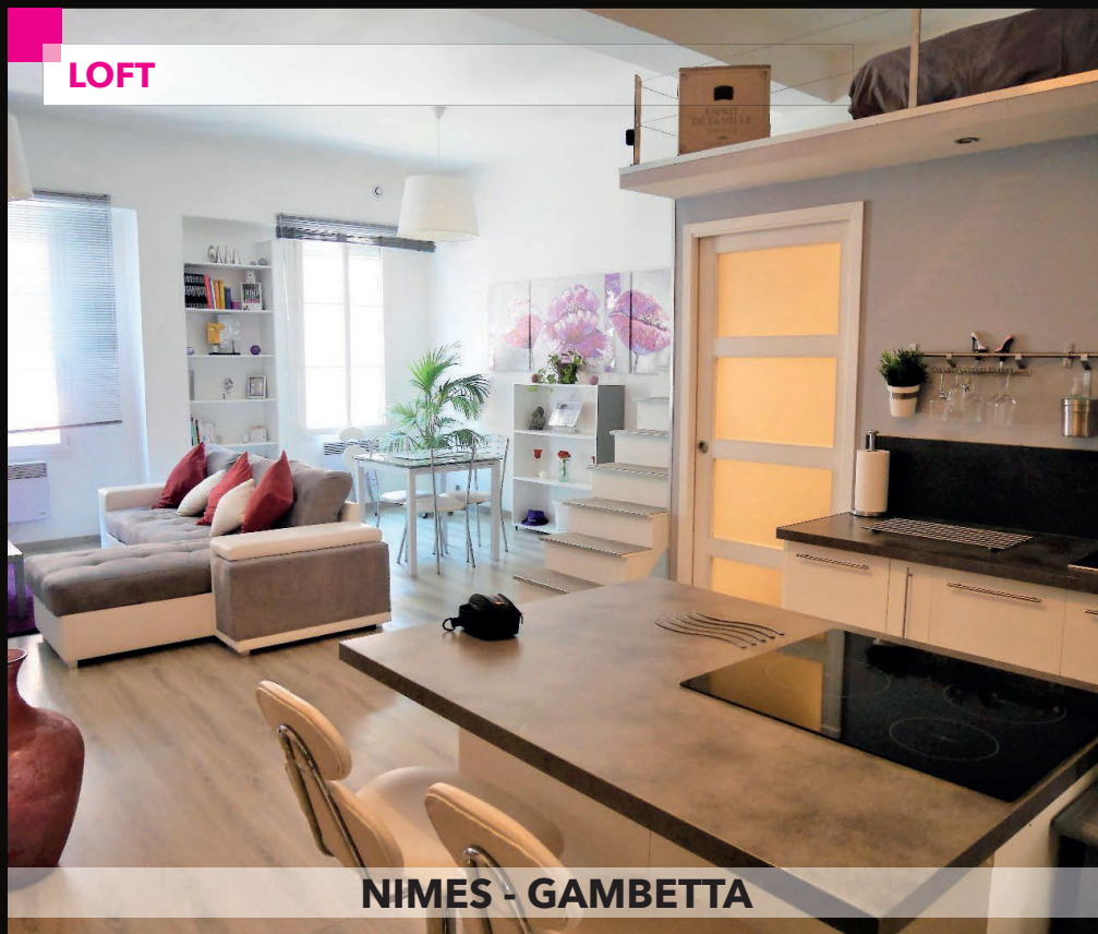
NIMES - GAMBETTA