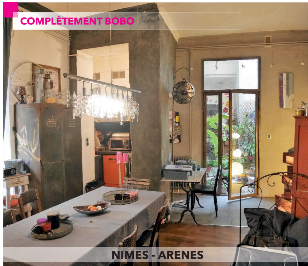
NIMES - ARENES