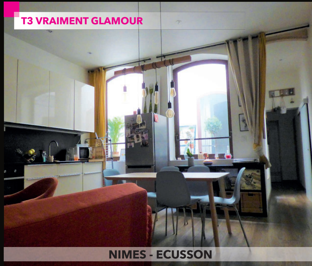
NIMES - ECUSSON