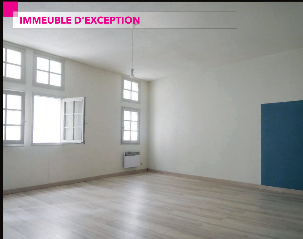
NIMES - ECUSSON