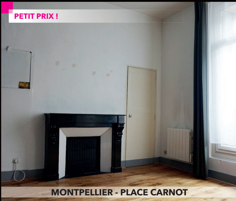
MONTPELLIER - PLACE CARNOT