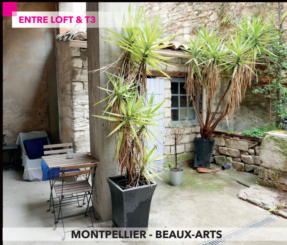
MONTPELLIER - BEAUX-ARTS