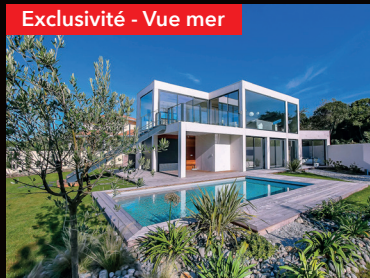
Exclusivité - Vue mer

Secteur très agréable et très recherché. Très belle villa moderne avec une superbe vue sur la mer, la montagne et le Golf. Rare. Salon / sam / cuisine, 5 chambres, 5 salles de bains, 6 wc, cuisine d'été, cave, garage. Plage à pied. Didier Lepinoux : 06 72 22 22 07 DPE : C