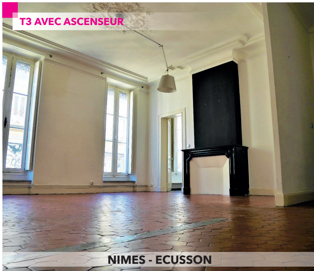
NIMES - ECUSSON