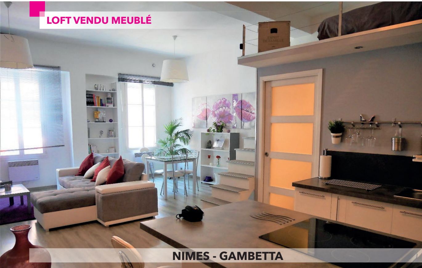
NIMES - GAMBETTA