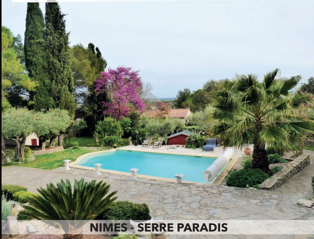
NIMES - SERRE PARADIS