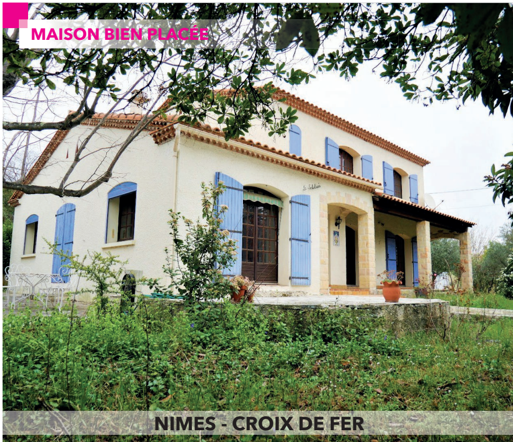
NIMES - CROIX DE FER