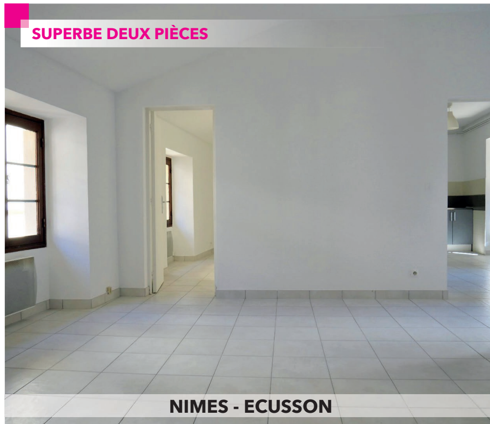
NIMES - ECUSSON