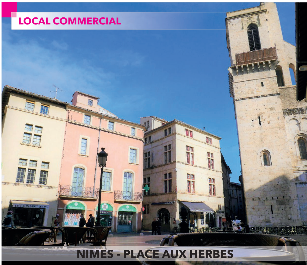
NIMES - PLACE AUX HERBES