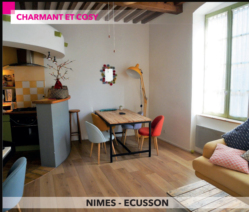
NIMES - ECUSSON