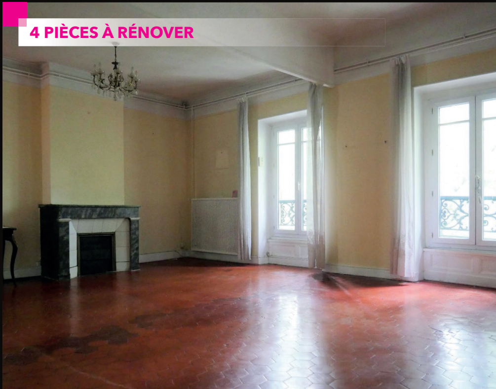
NIMES - GAMBETTA