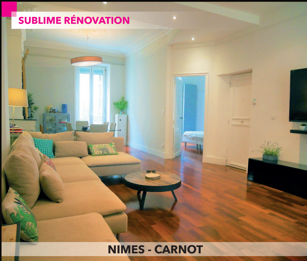
NIMES - CARNOT