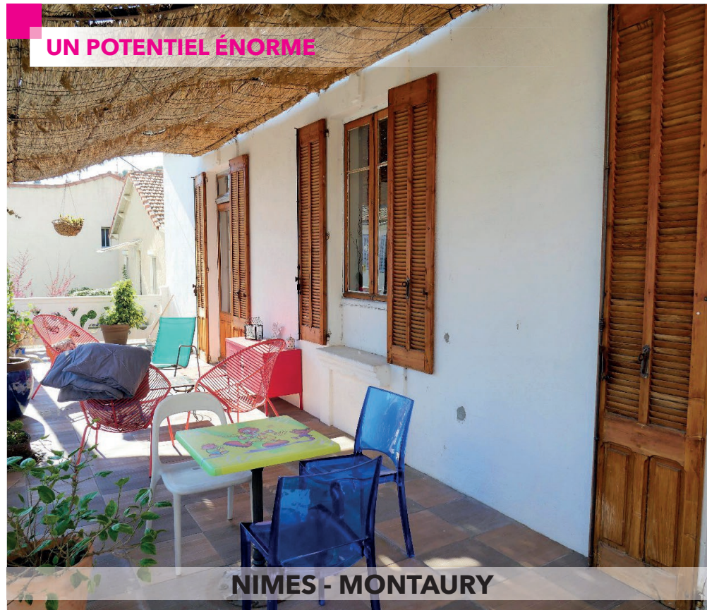
NIMES - MONTAURY