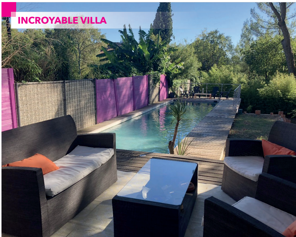
NIMES - TOUR MAGNE