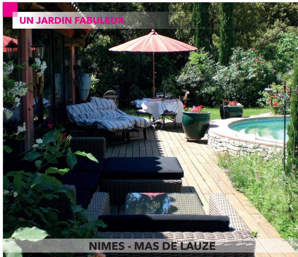
NIMES - MAS DE LAUZE