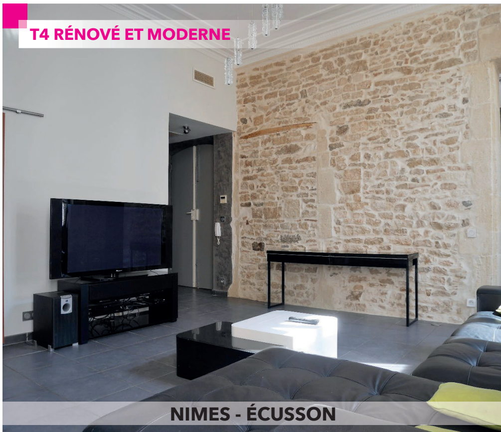
NIMES - ÉCUSSON