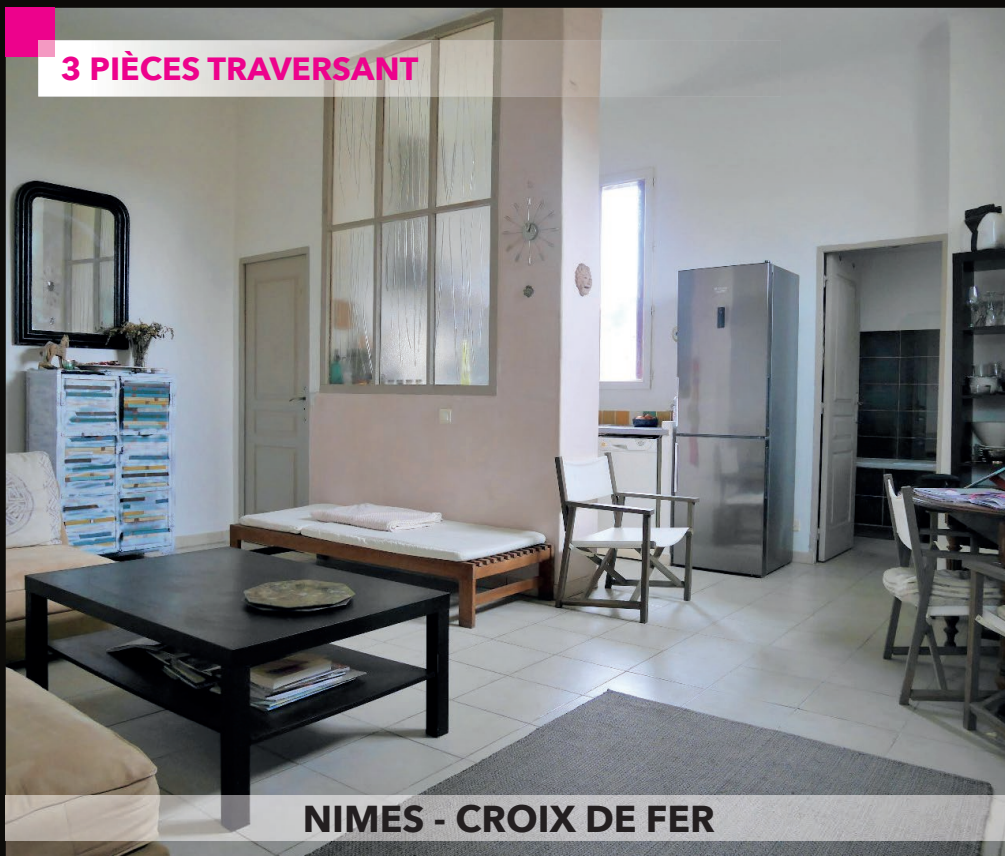
NIMES - CROIX DE FER