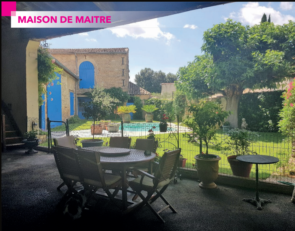
GENERAC - CENTRE