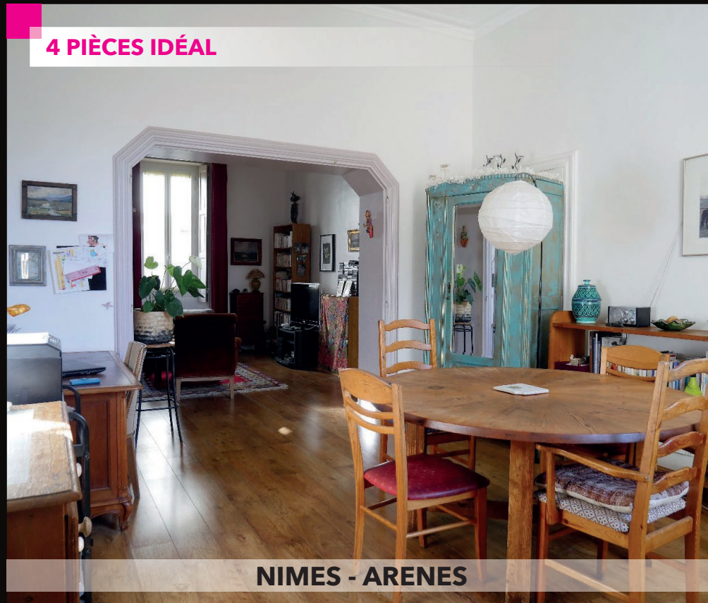
NIMES - ARENES