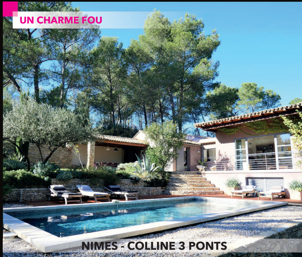
NIMES - COLLINE 3 PONTS