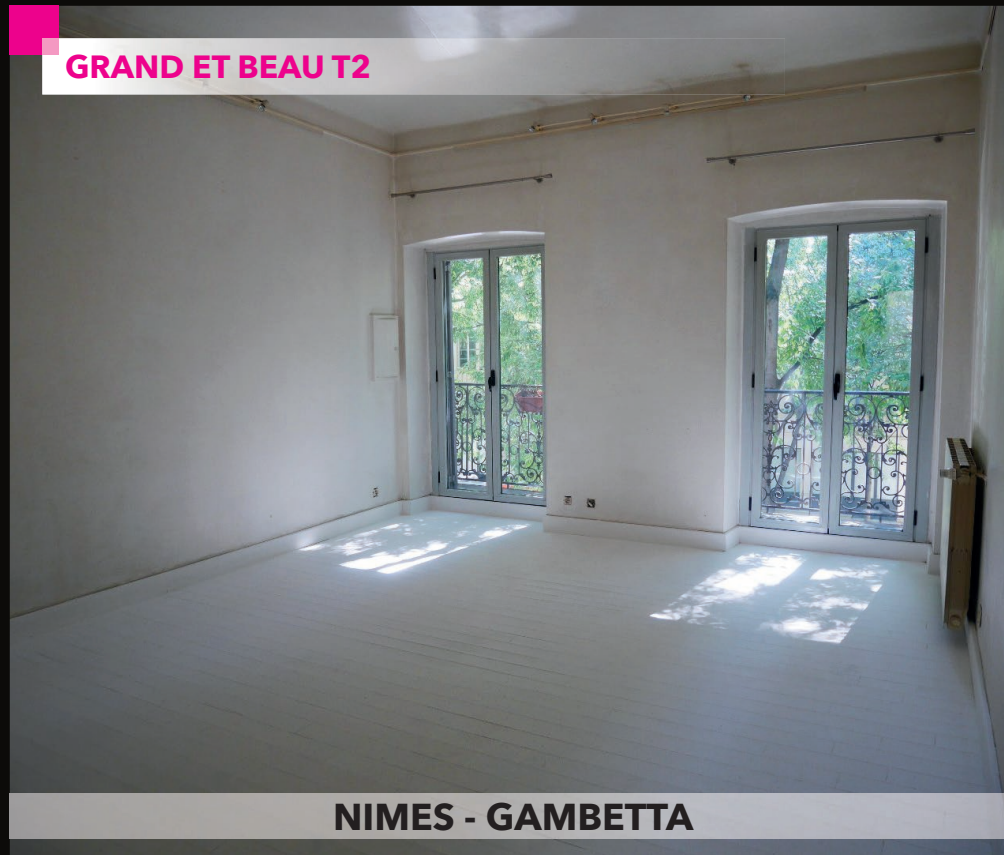
NIMES - GAMBETTA