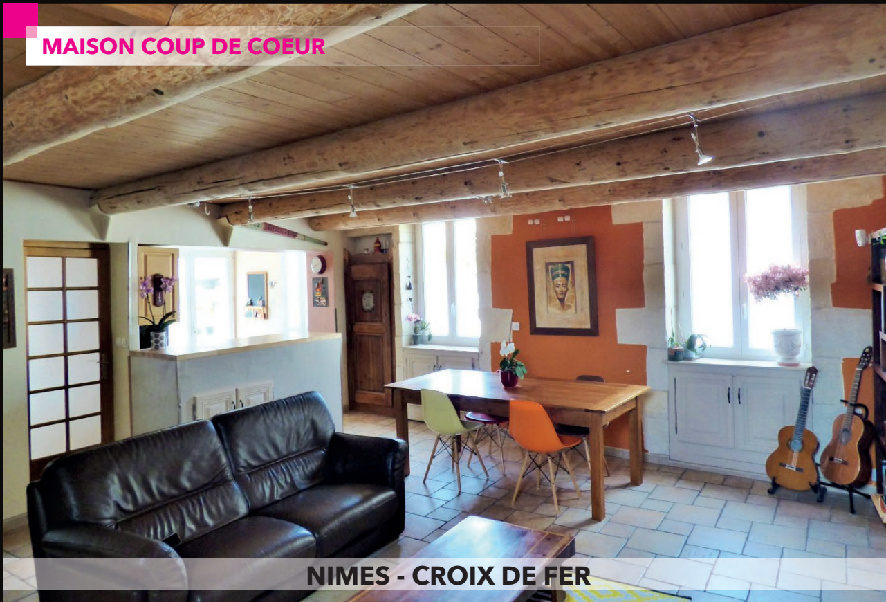
NIMES - CROIX DE FER