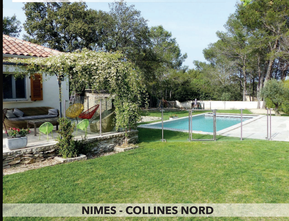
NIMES - COLLINES NORD