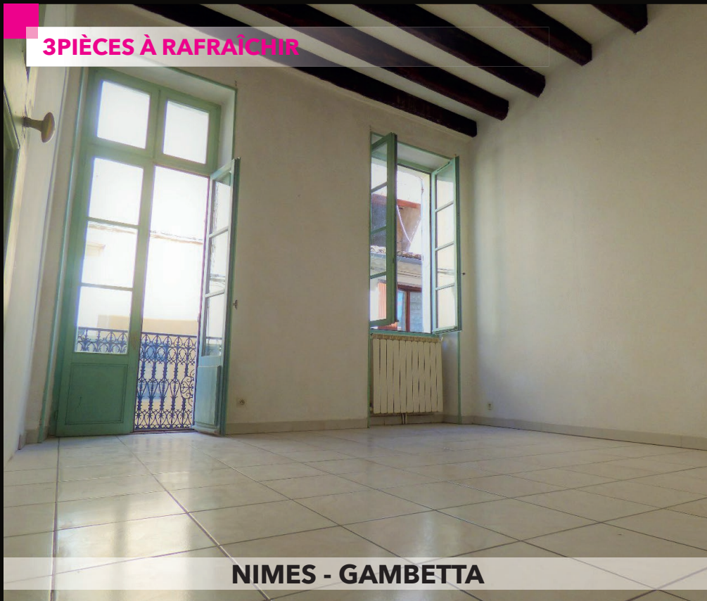
NIMES - GAMBETTA