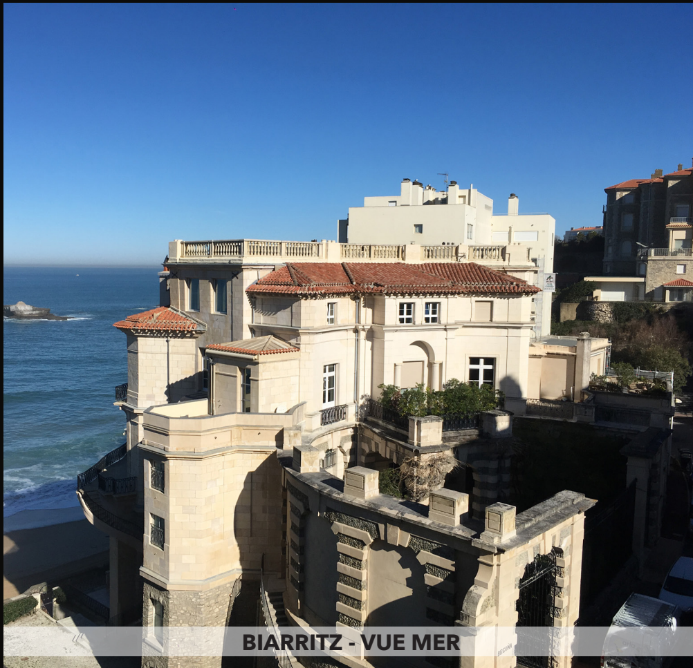
BIARRITZ - VUE MER