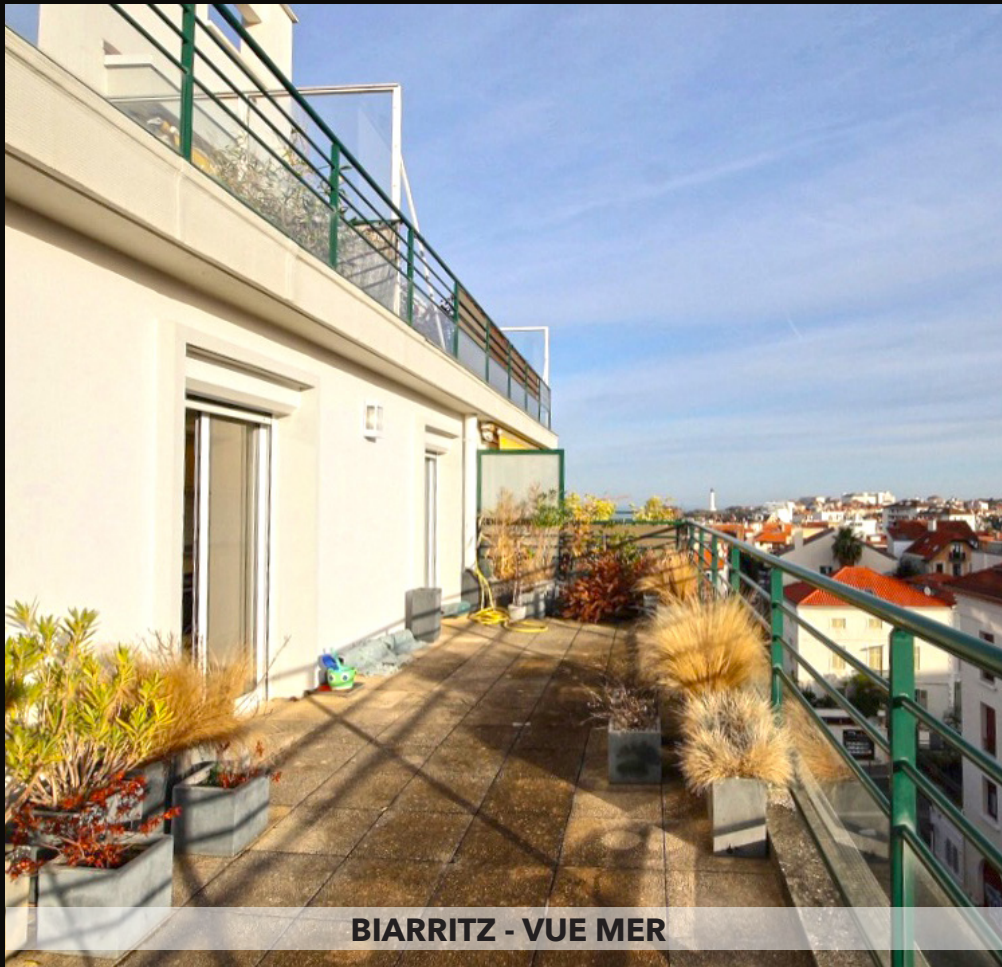
BIARRITZ - VUE MER