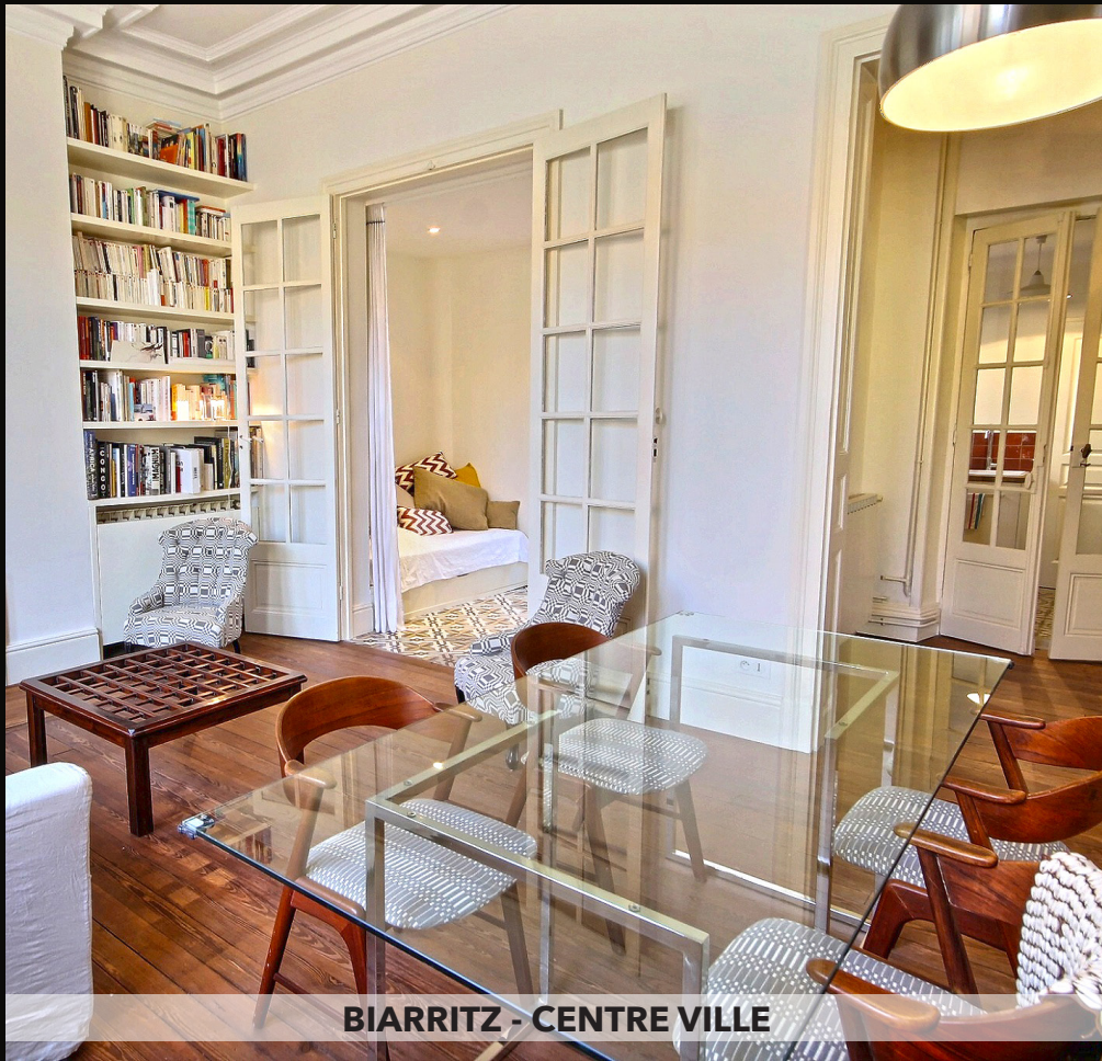
BIARRITZ - CENTRE VILLE