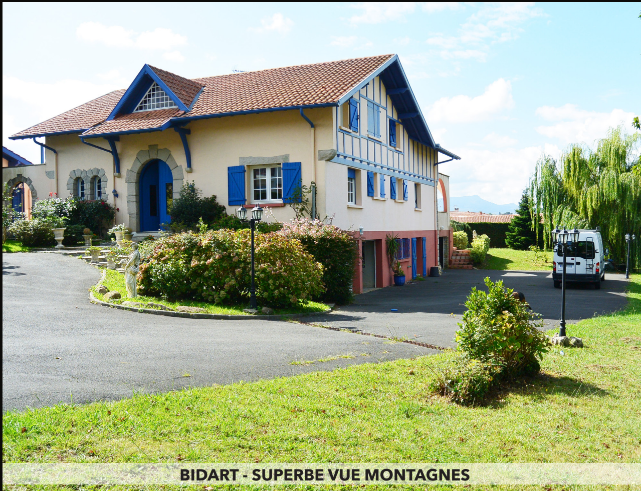
BIDART - SUPERBE VUE MONTAGNES