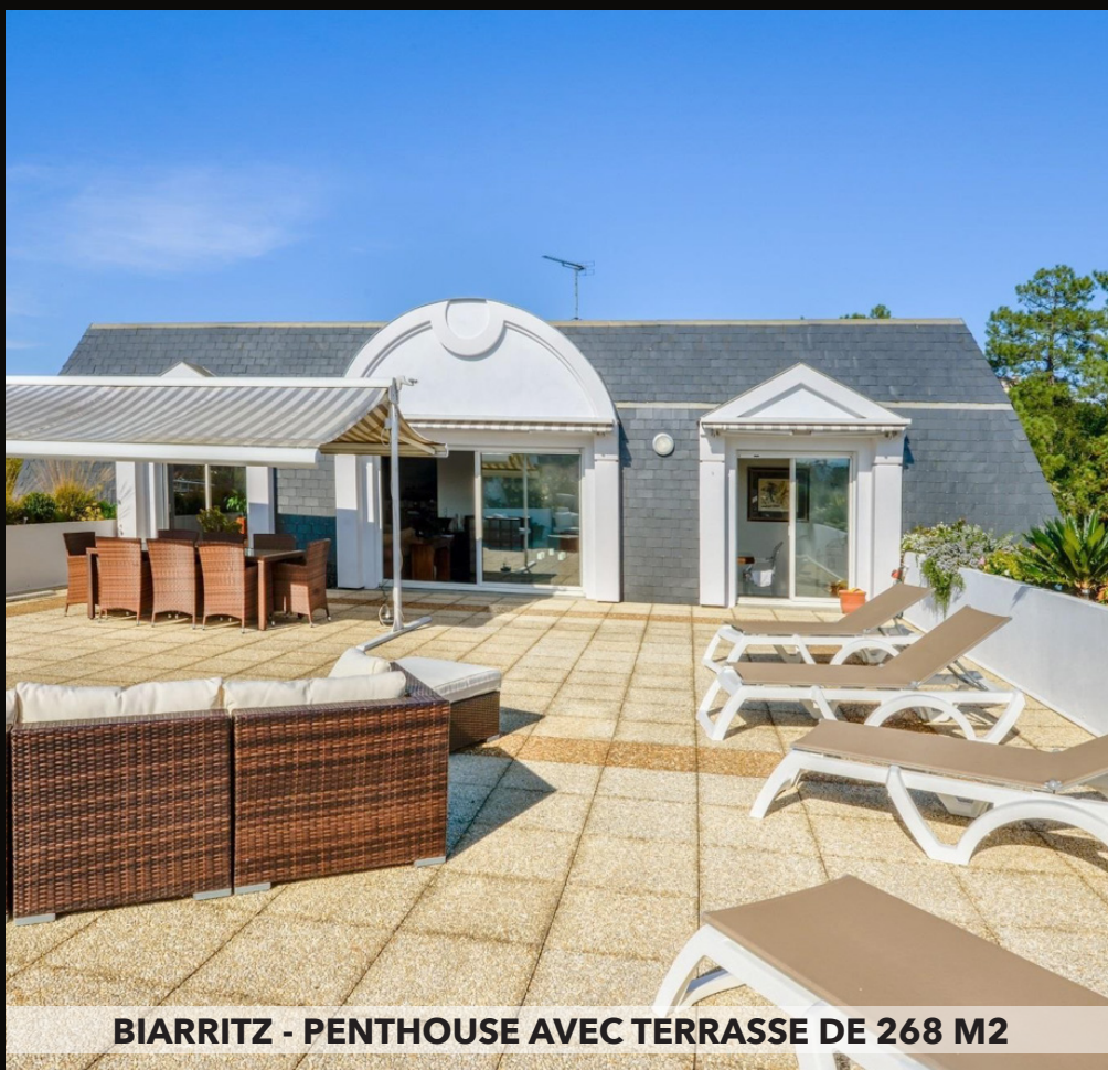
BIARRITZ - PENTHOUSE AVEC TERRASSE DE 268 M2