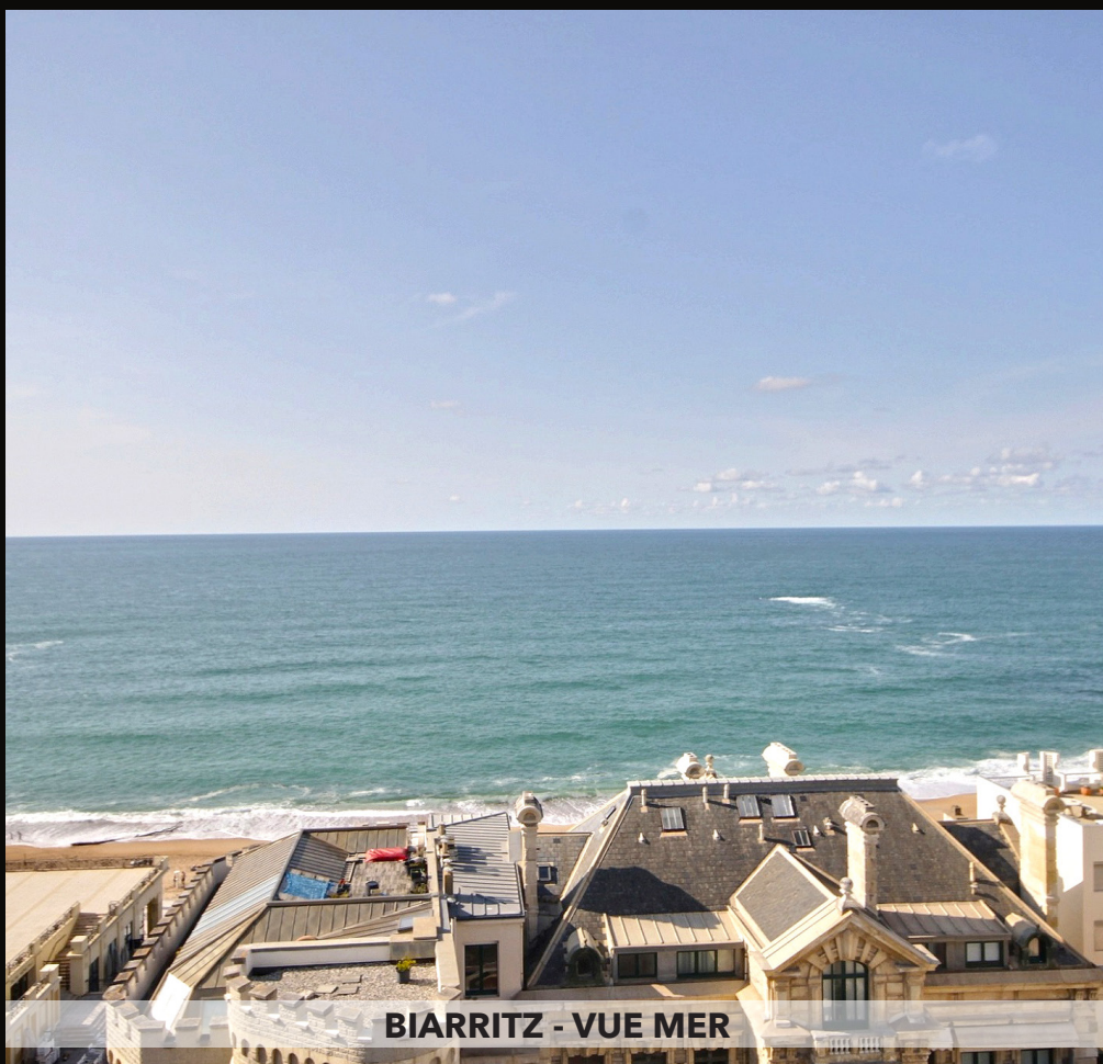
BIARRITZ - VUE MER