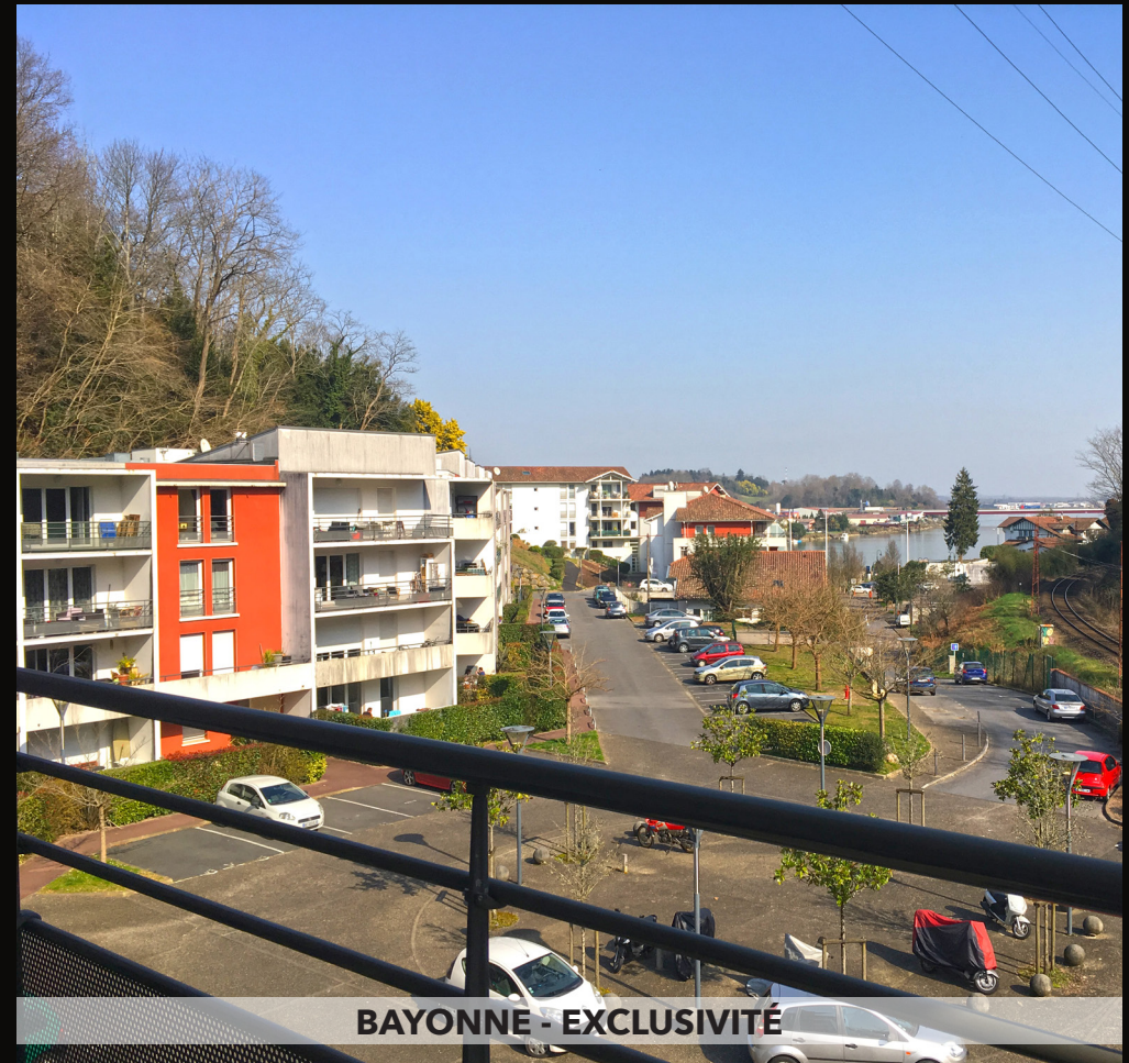
BAYONNE - EXCLUSIVITÉ

Sur le Golf, vaste T2 avec chambre séparée dans une résidence neuve de standing. D'une superficie de 45 m 2 , orienté Sud Est, il bénéficie d'une terrasse de 20m 2 , cave et parking en sous-sol. Environnement très calme, coup de cœur, situé à 800 m du centre ville de Saint jean de Luz. 40 lots, 850 € de charges / an. Honoraires à la charge du vendeur. DPE : D