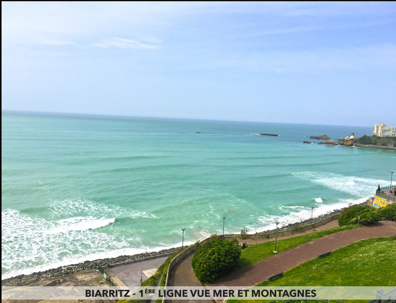
BIARRITZ - 1 ÈRE LIGNE VUE MER ET MONTAGNES