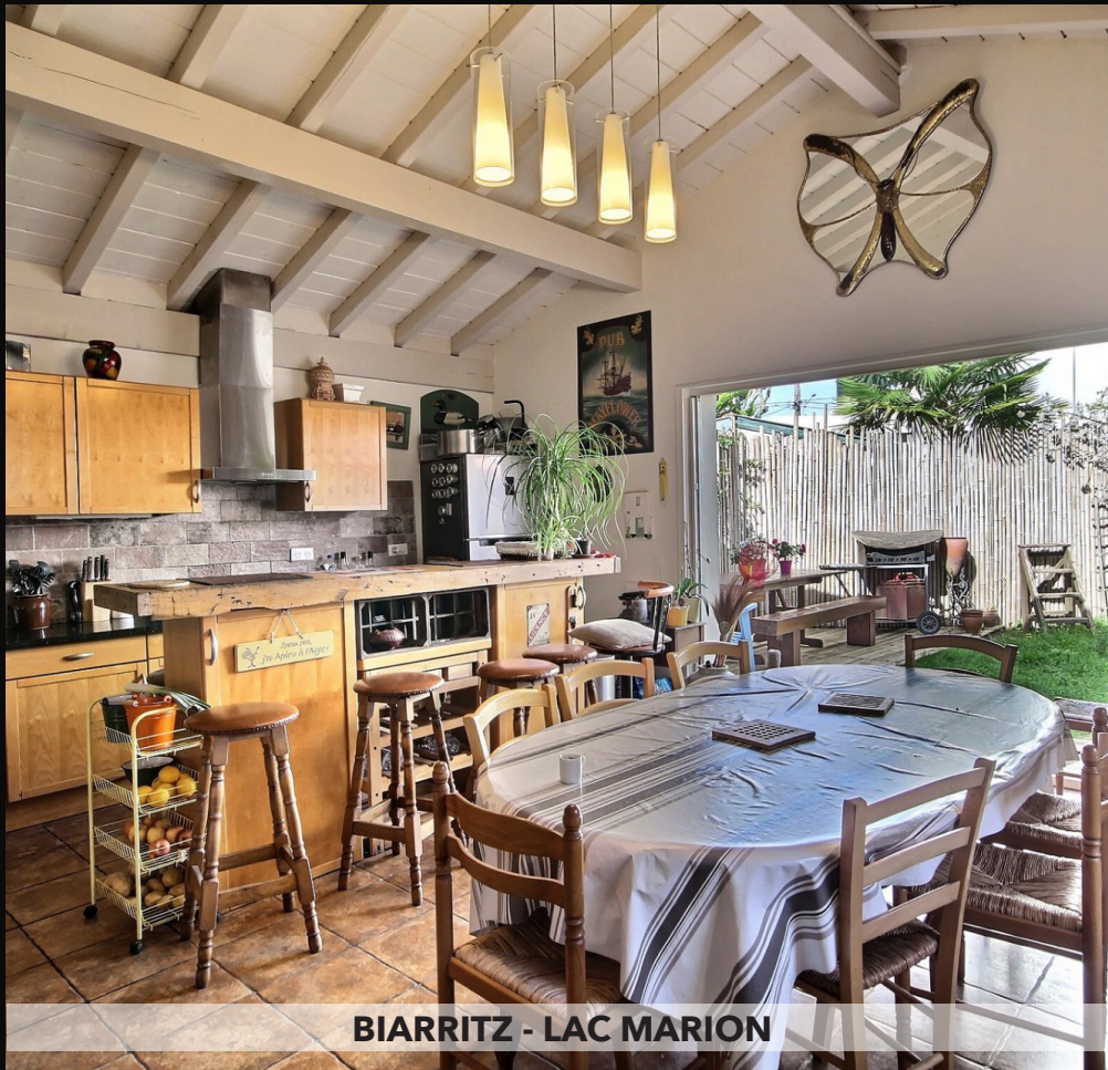
BIARRITZ - LAC MARION