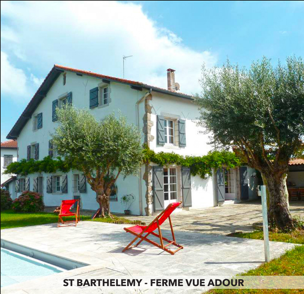
ST BARTHELEMY - FERME VUE ADOUR