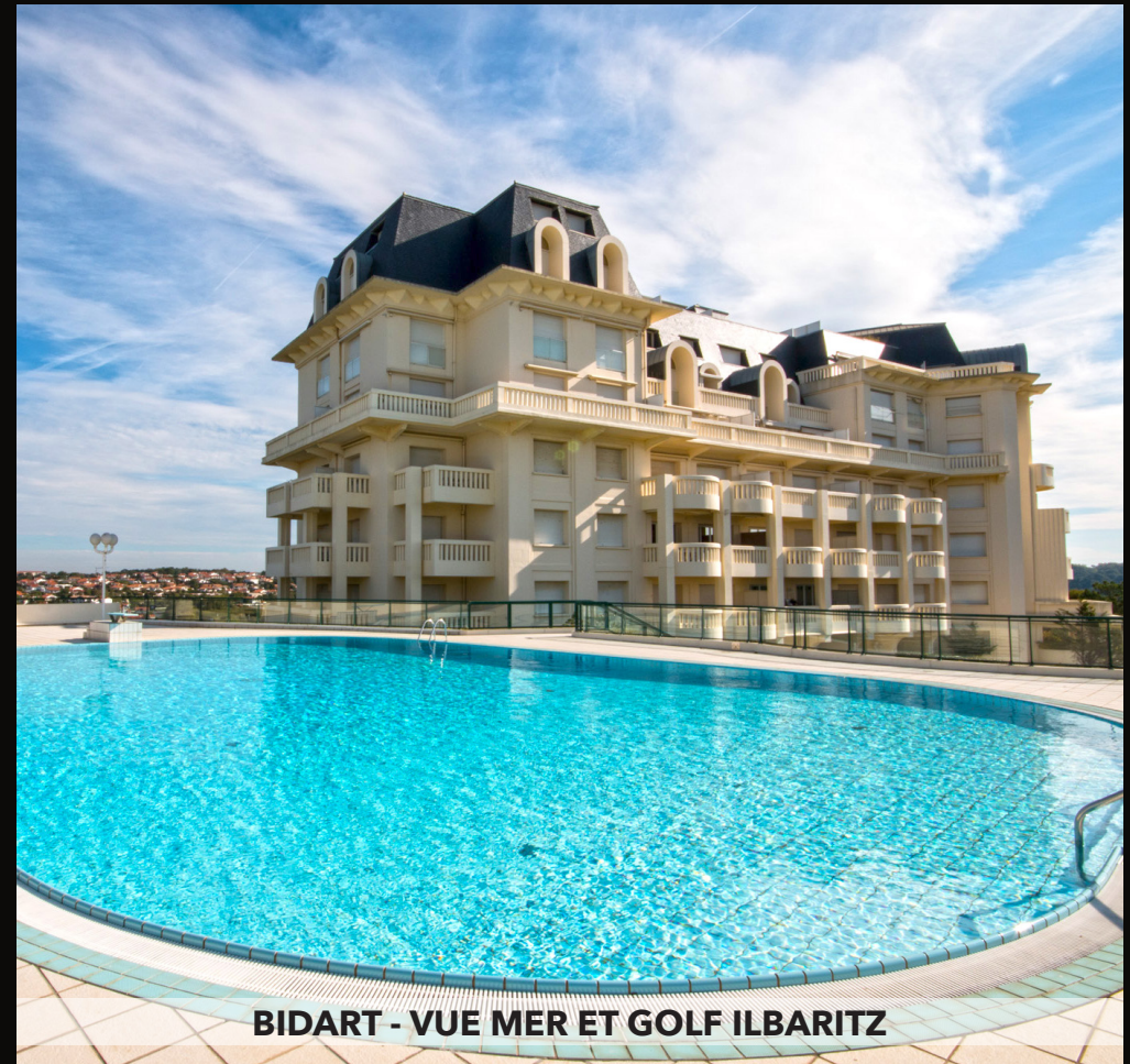
BIDART - VUE MER ET GOLF ILBARITZ

Plage du Miramar Dans une résidence de standing avec ascenseur, vaste studio de 28 m 2 prolongé par une terrasse située en étage élevé. 270 lots, 2640 € de charges / an. Honoraires à la charge du vendeur. DPE : C