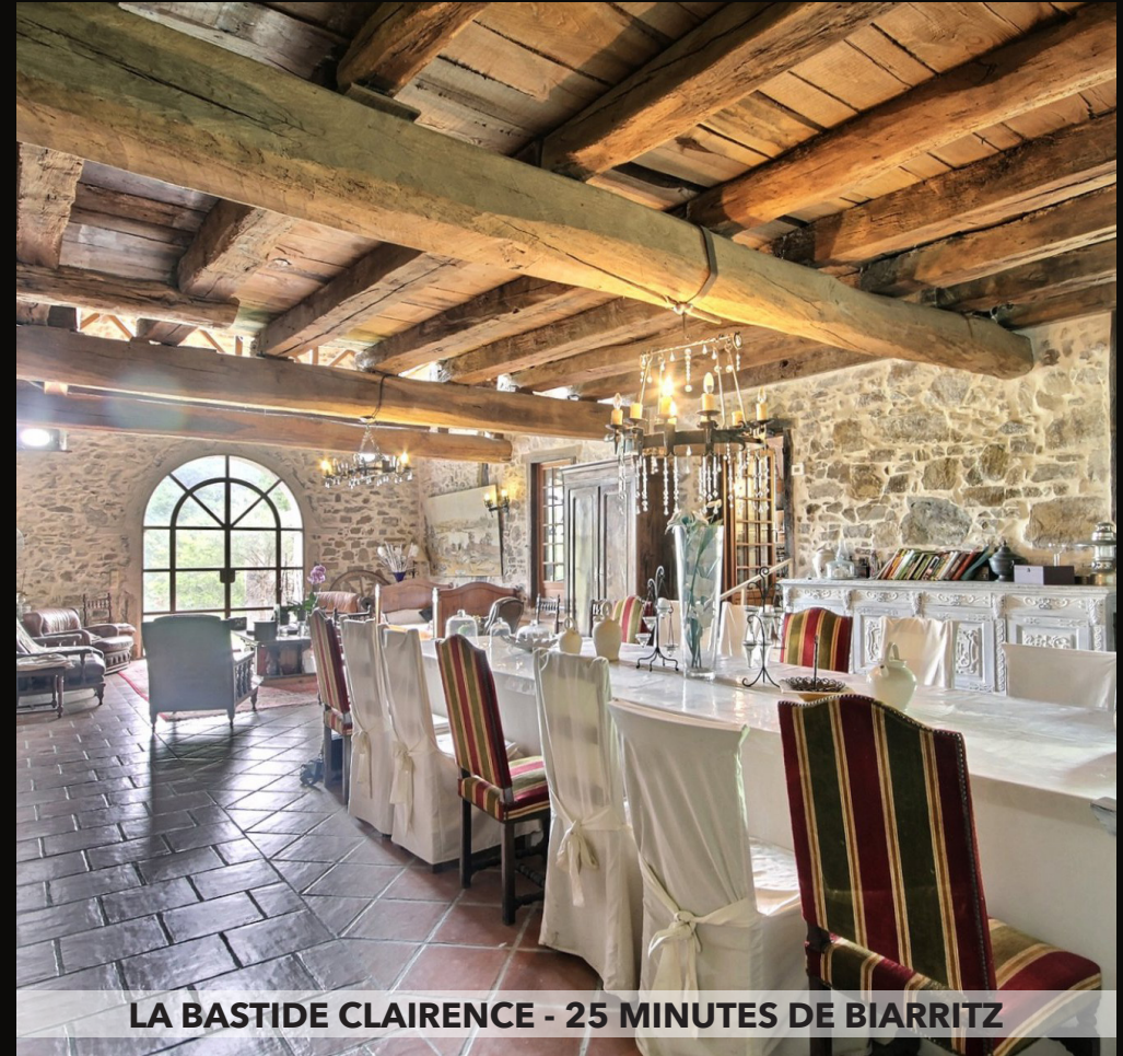
LA BASTIDE CLAIRENCE - 25 MINUTES DE BIARRITZ

Magnifique ferme d'environ 450 m 2 en bordure d'Adour en parfait état. Belles pièces de réception avec cheminées, grande cuisine équipée récente, bureau, spacieuse mezzanine, 6 chambres, 6 salles de bains, grande pièce traversante en dernier étage avec poutres apparentes, grenier, dépendances avec garage, atelier, cave, joli jardin plat de 3132 m 2 avec piscine. Terrasse avec cuisine d'été et sauna! Beaucoup de charme et d'authenticité au bord de l'Adour. Honoraires à la charge du vendeur. DPE : D