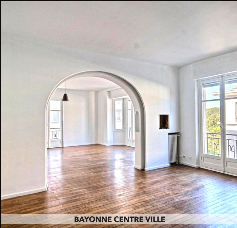
BAYONNE CENTRE VILLE