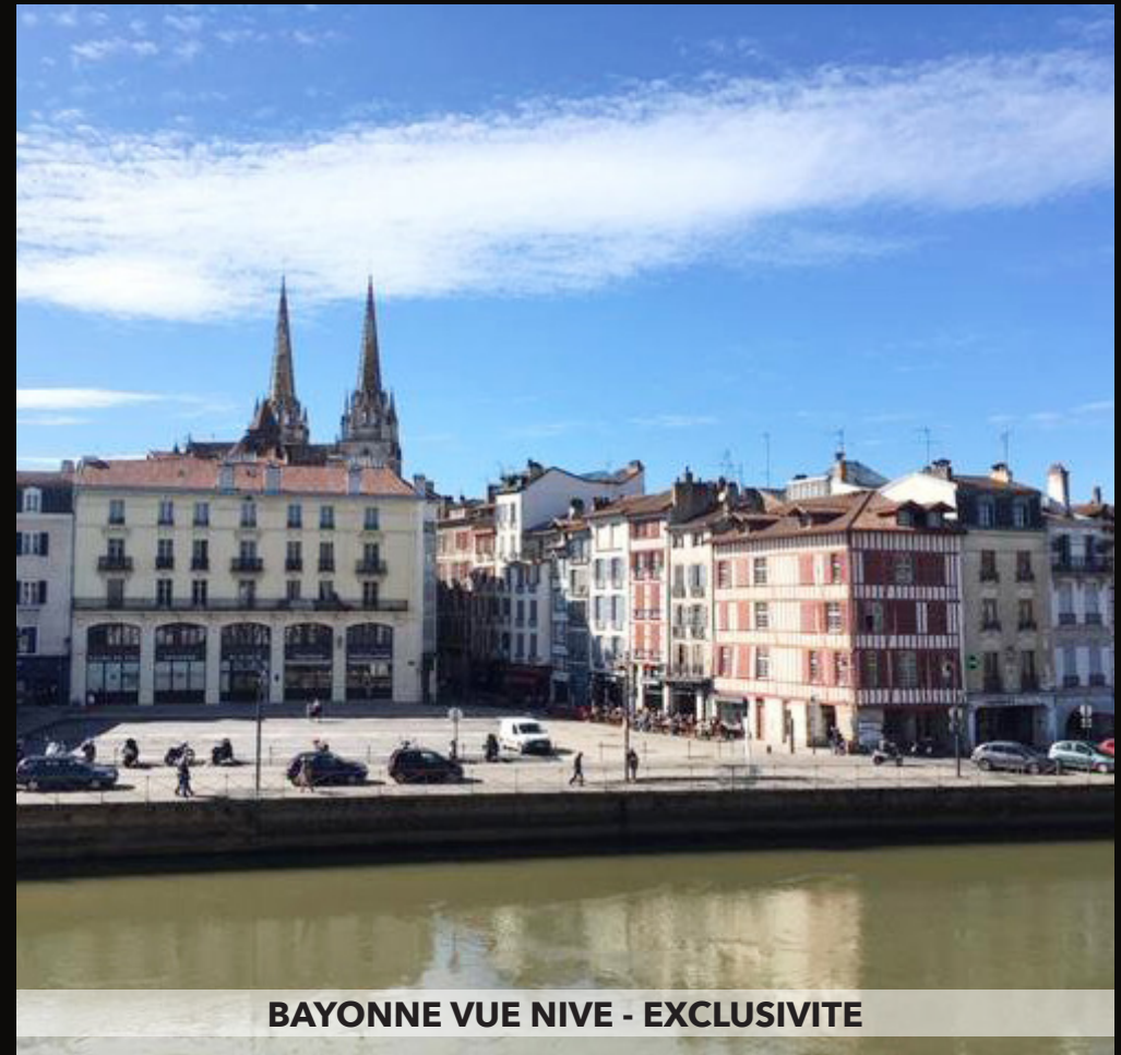
BAYONNE VUE NIVE - EXCLUSIVITE

Dans bel immeuble art-déco avec ascenseur. Magnifique appartement de charme. Beau hall d'entrée, splendide pièce de vie avec cheminée, dégagement, cuisine indépendante, 3 chambres, salle de bains, grande buanderie. Beaux parquets, hauteur sous plafond, belle lumière et authenticité ! Garage et cave. Excellent rapport/qualité/prix ! Bien rare ! 78 Lots, 3400 € charges/ an. Honoraires à la charge du vendeur. DPE : Vierge