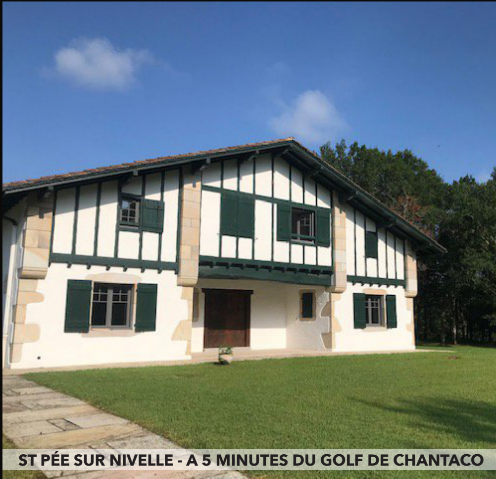
ST PÉE SUR NIVELLE - A 5 MINUTES DU GOLF DE CHANTACO