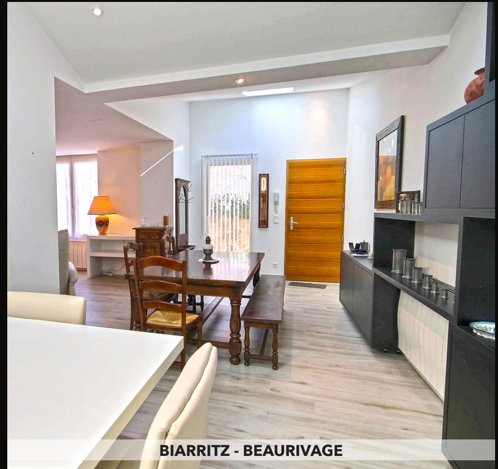
BIARRITZ - BEAURIVAGE

Bel appartement de 62 m 2 , ayant fait l'objet d'une rénovation complète avec gout et qualité. Il se compose d'une vaste entrée desservant le séjour avec belles hauteurs sous plafond, bureau ouvrant sur un jardin de 40 m 2 , jolie chambre avec de nombreux rangements. Petite copropriété. 8 lots, 600€ de charges / an. Honoraires à la charge du vendeur. DPE : Vierge