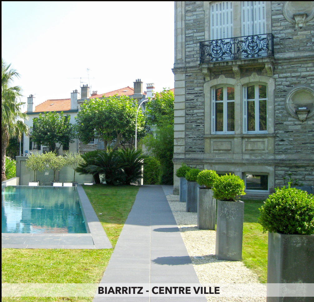
BIARRITZ - CENTRE VILLE