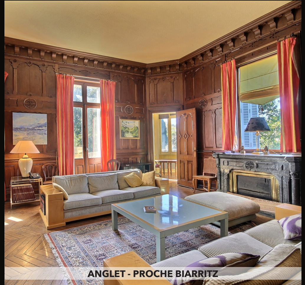
ANGLET - PROCHE BIARRITZ

Très bel appartement de quatre pièces principales situé au 2 ème étage avec ascenseur d'une résidence de standing en excellent état. Un mode de vie tout à pied dans un cadre de toute beauté ! 23 lots, 2100€ de charges / an. Honoraires à la charge du vendeur. DPE : Vierge