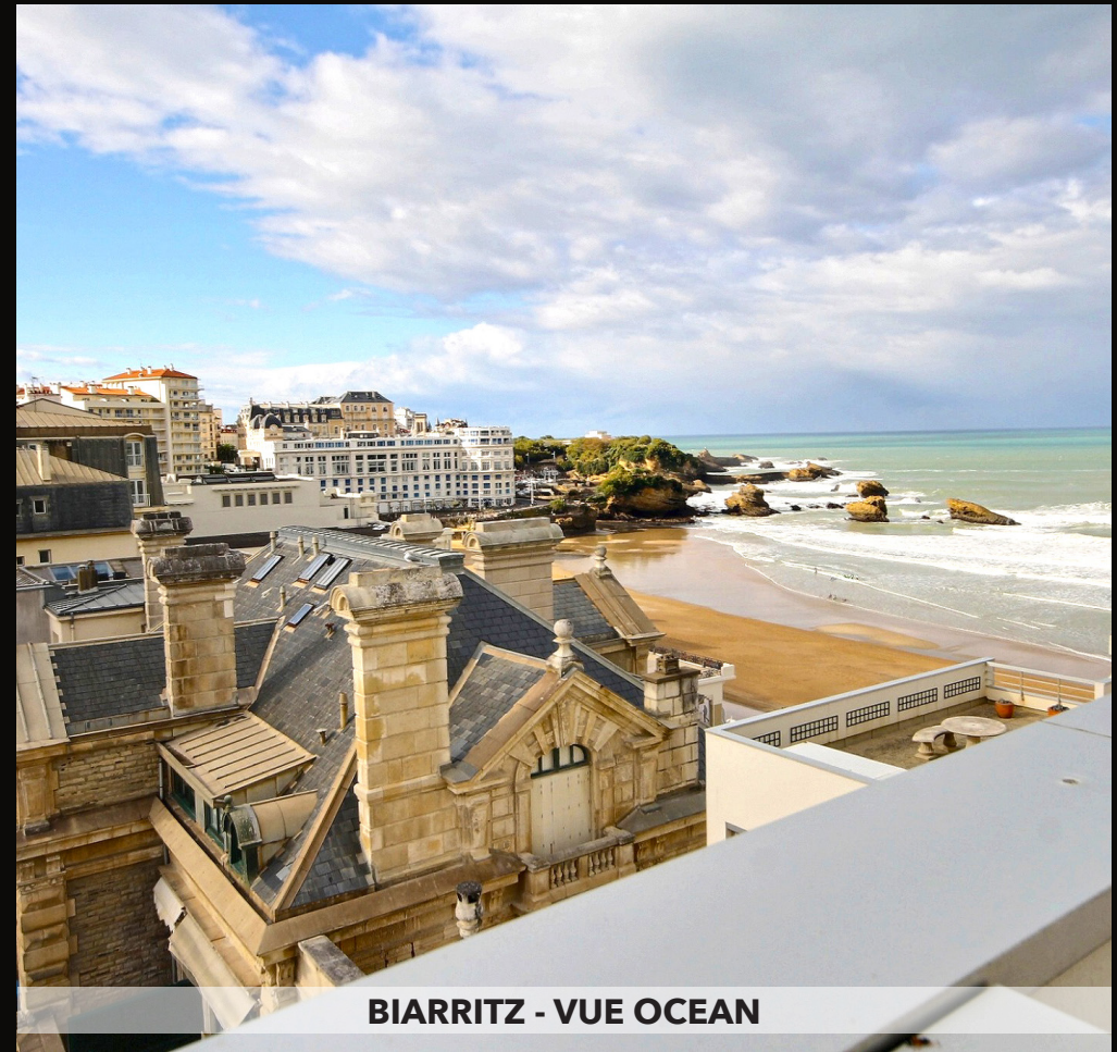
BIARRITZ - VUE OCEAN

Bel appartement lumineux avec vue dominante sur BIARRITZ. Bénéficiant d'une chambre séparée, cuisine entièrement équipée, belles prestations, vaste terrasse de 32 m 2 et cave. Situation privilégiée en Centre Ville à proximité de la place Clemenceau et de la plage. 150 lots, 1320 € de charges / an. Honoraires à la charge du vendeur. DPE : F