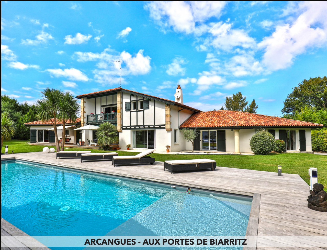
ARCANGUES - AUX PORTES DE BIARRITZ