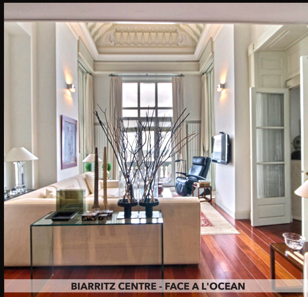
BIARRITZ CENTRE - FACE A L'OCEAN

Au dernier étage d'une résidence de standing avec piscines et tennis. Superbe duplex de 190 m 2 jouissant d'une très belle vue dégagée sur la ville de Biarritz et l'océan au loin. Espace de vie de 80 m 2 , baigné de lumière ouvre sur la terrasse de 268 m 2 . 3 chambres dont une suite parentale, bureau. Entièrement rénové et repensé avec des matériaux de grande qualité. Ascenseur intérieur, 2 garages, 2 caves complètent ce bien rarissime sur Biarritz ! 225 lots, 4800 € de charges / an. Honoraires à la charge du vendeur. DPE : B