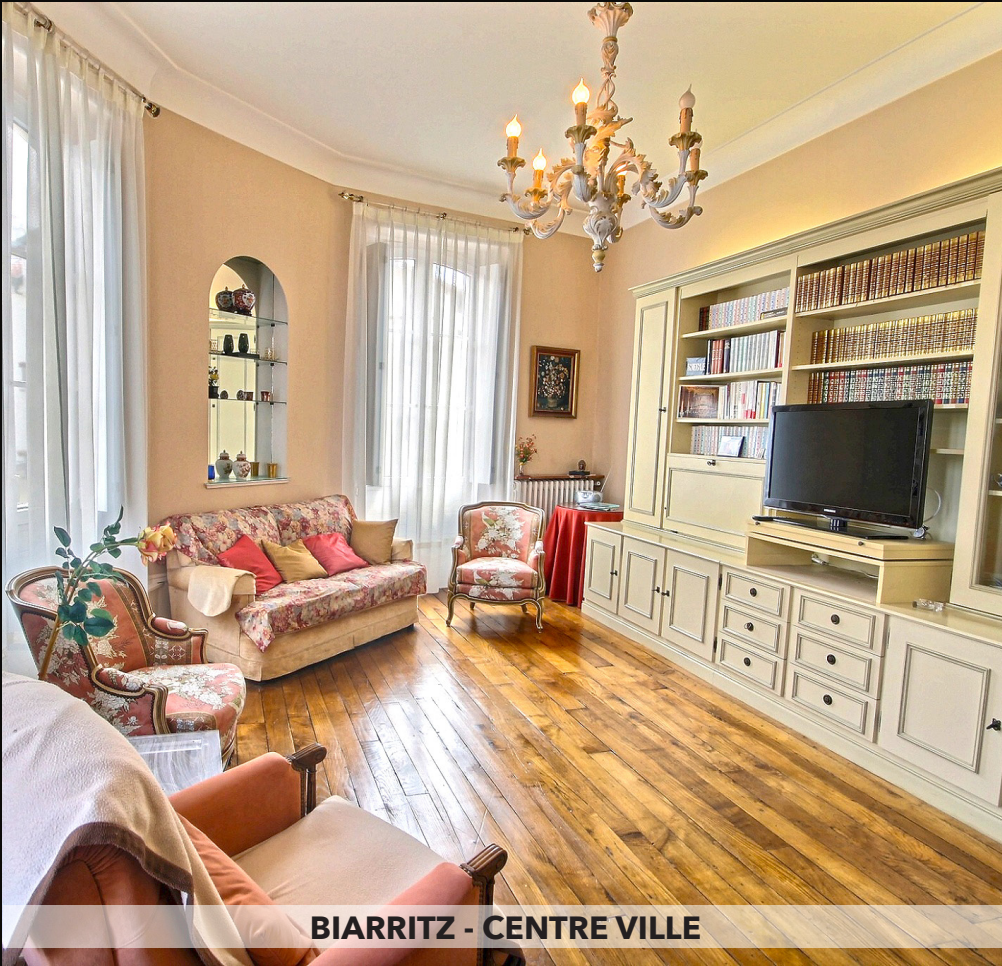
BIARRITZ - CENTRE VILLE