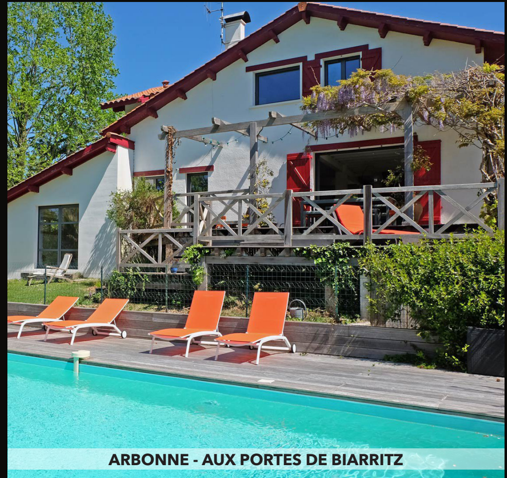
ARBONNE - AUX PORTES DE BIARRITZ

Maison de ville avec jardin et garage. Jolie maison de ville rénovée, d'environ 100 m 2 , située dans un quartier résidentiel de Biarritz, proche du Lac Marion. Elle dispose d'un grand espace de vie : salon, salle à manger et cuisine ouvrant sur un petit jardin. Deux chambres de plain pied, une salle d'eau, des WC séparés ainsi qu'une buanderie complètent ce niveau. A l'étage, des combles aménagées accueillent une chambre et un coin bureau. Le plus, un grand garage. Honoraires à la charge du vendeur. DPE : Vierge