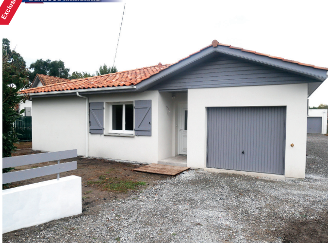
MAISON PLAIN PIED