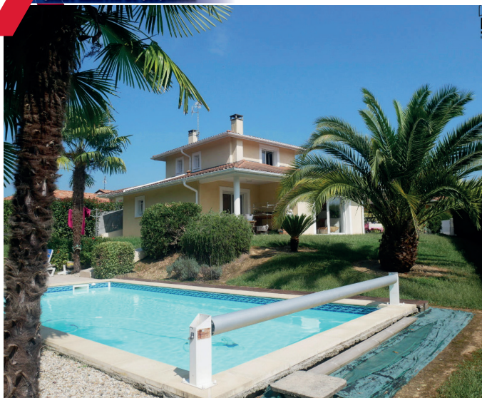
MAISON T4 CONTEMPORAINE