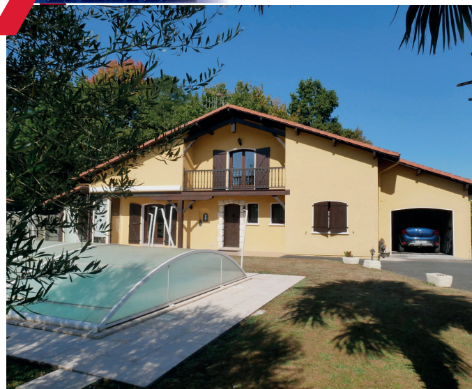
MAISON CENTRE BOURG