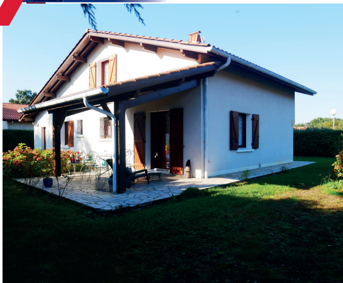
MAISON SECTEUR PLAGE