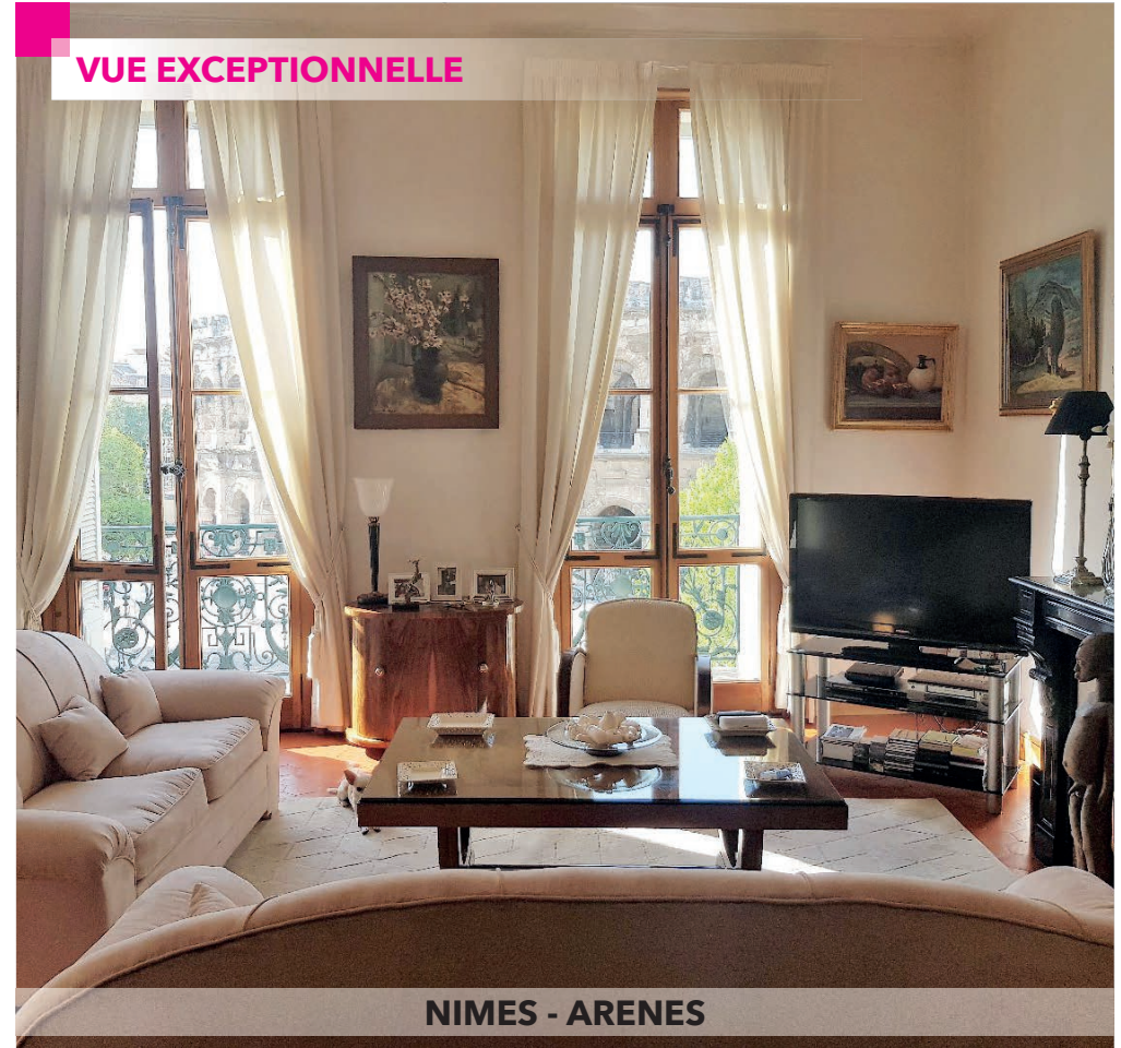
NIMES - ARENES