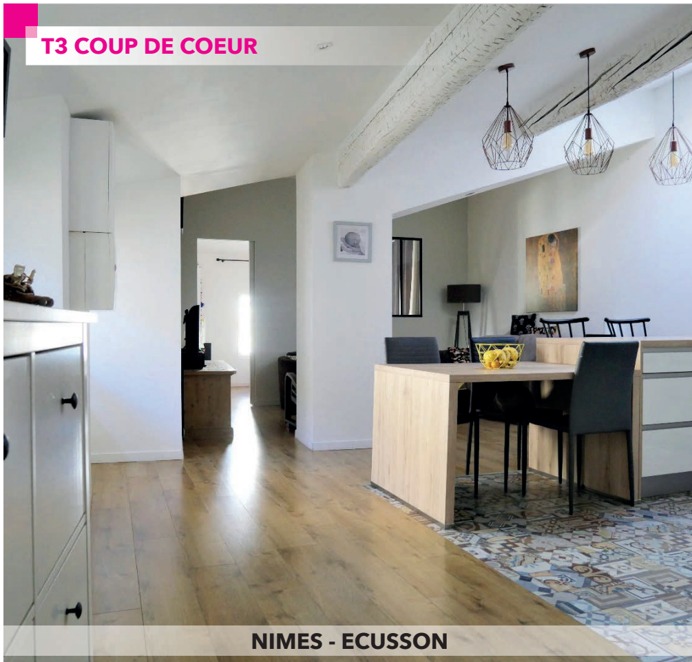
NIMES - ECUSSON