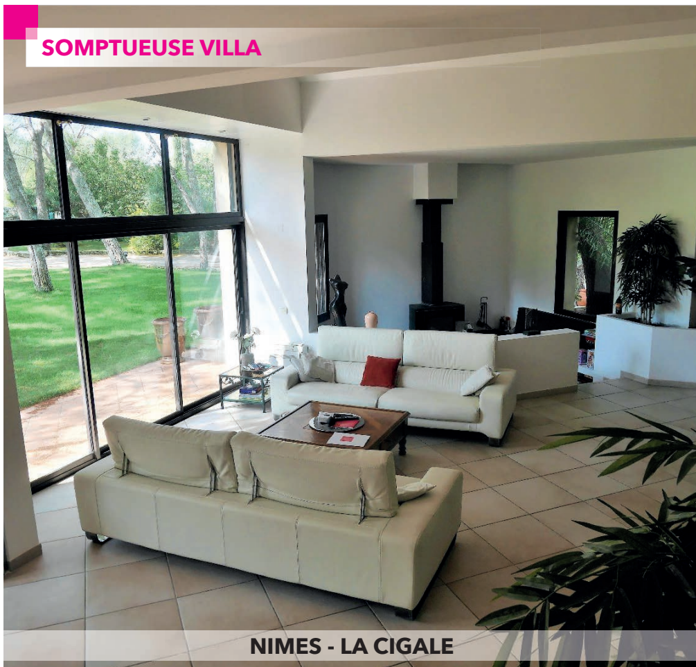
NIMES - LA CIGALE