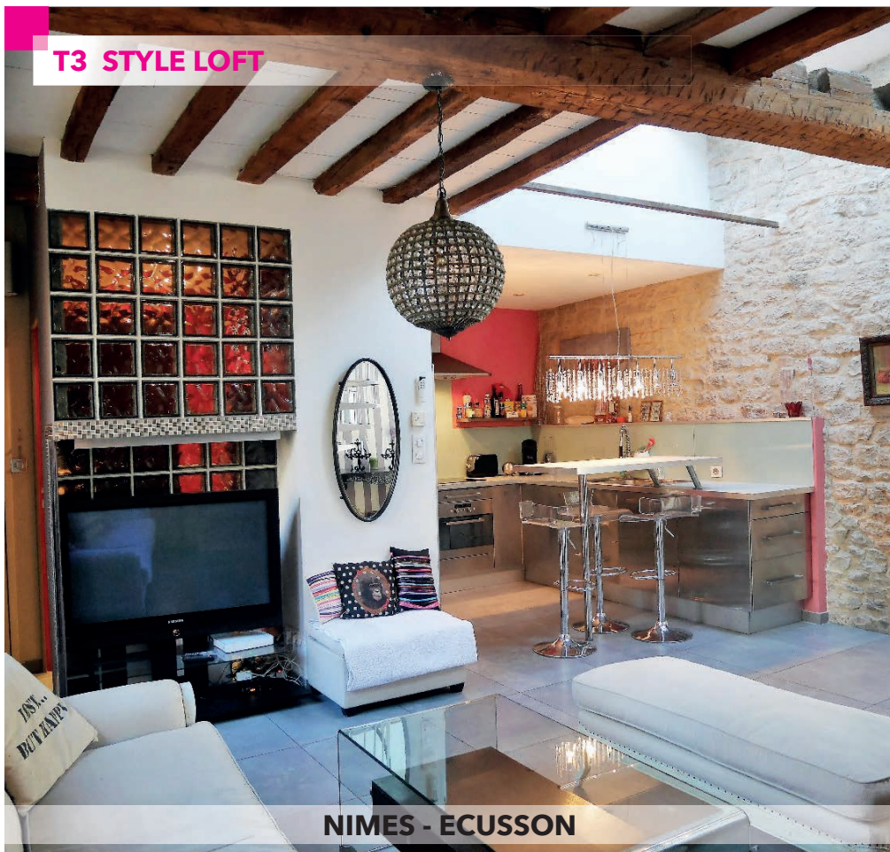
NIMES - ECUSSON