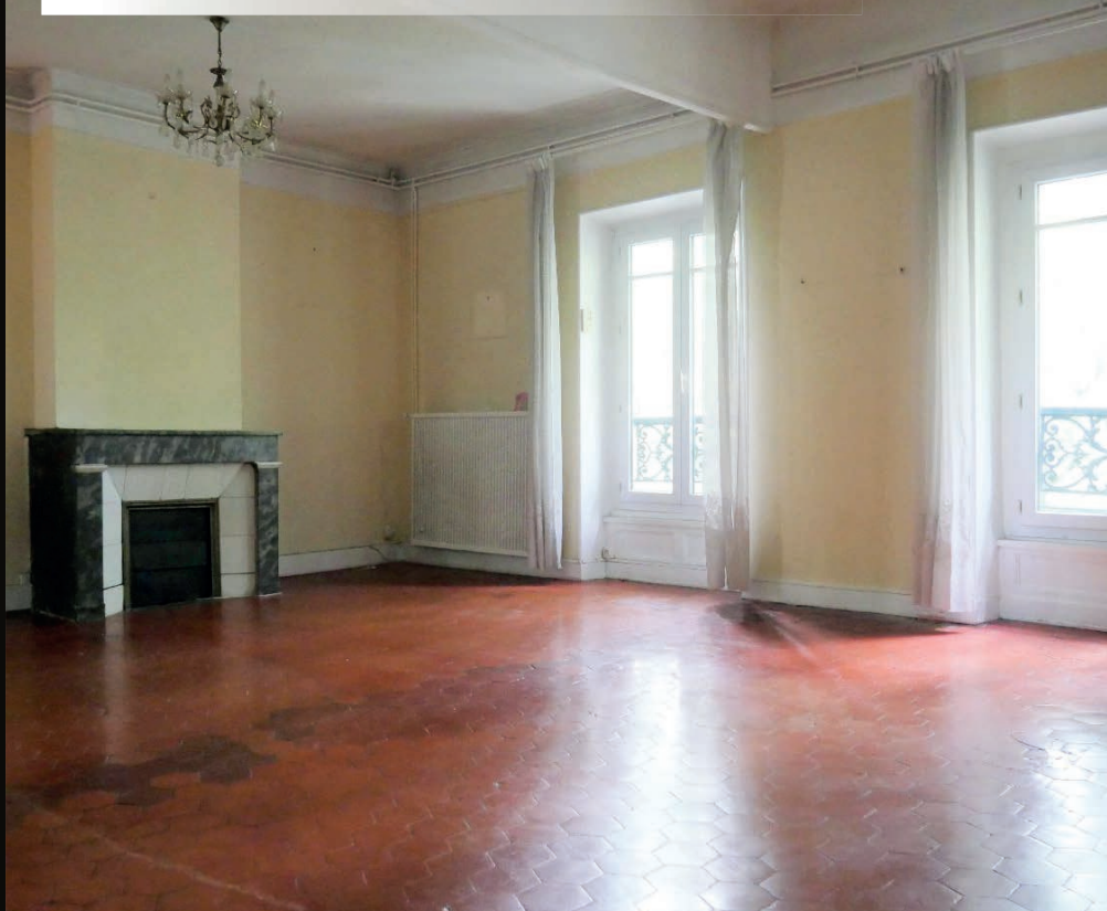
NIMES - GAMBETTA