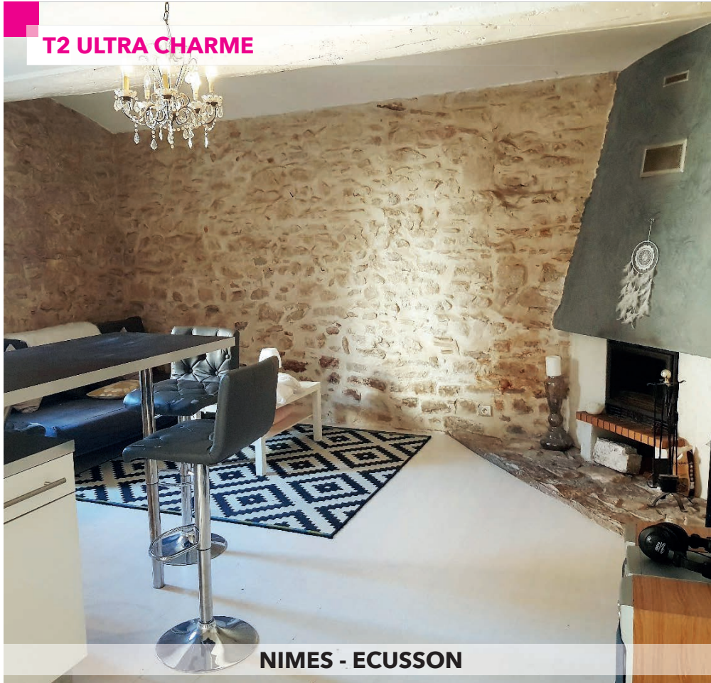
NIMES - ECUSSON