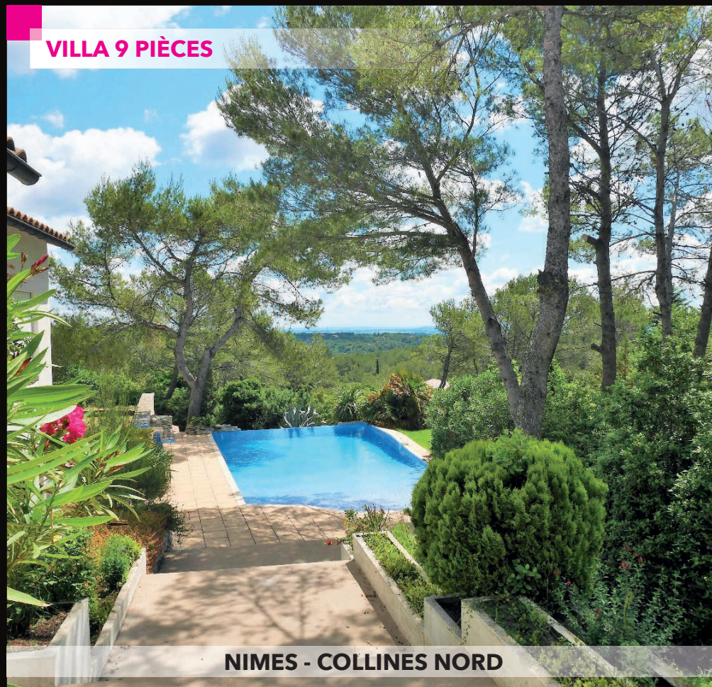
NIMES - COLLINES NORD