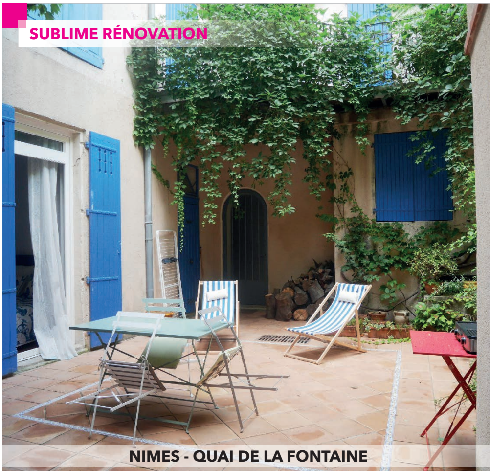
NIMES - QUAI DE LA FONTAINE