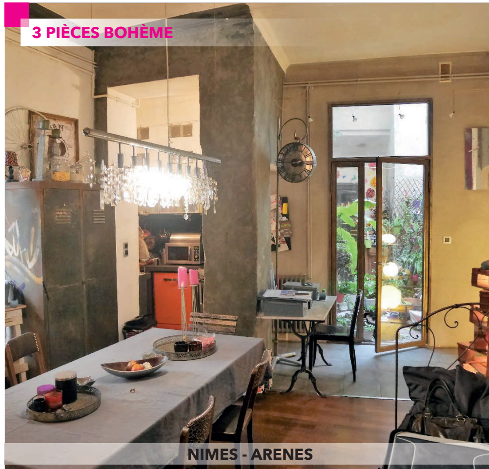
NIMES - ARENES