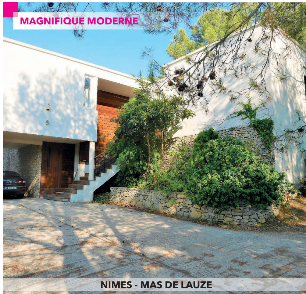
NIMES - MAS DE LAUZE