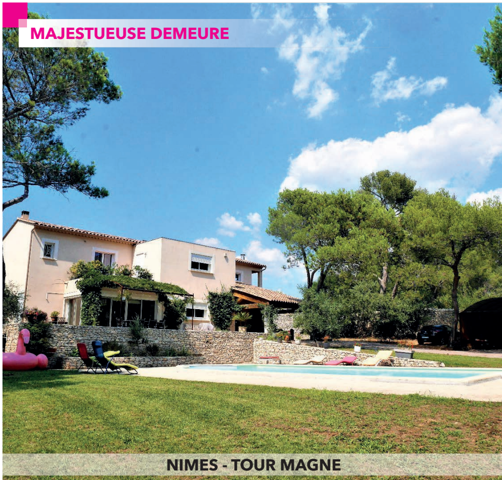
NIMES - TOUR MAGNE