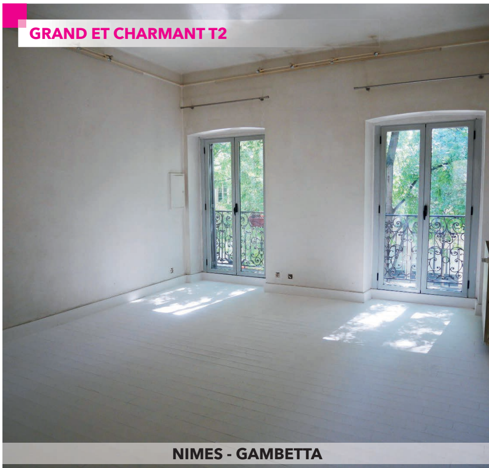
NIMES - GAMBETTA