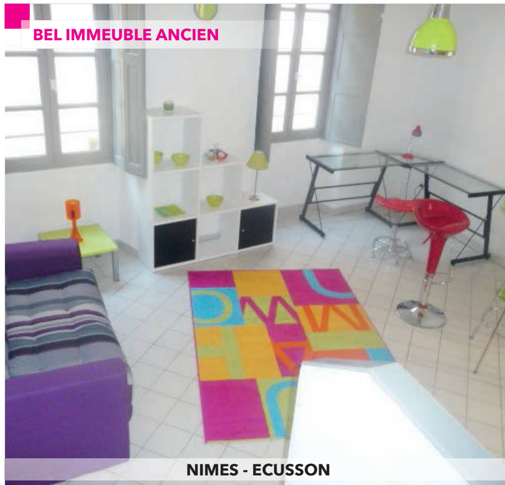
NIMES - ECUSSON