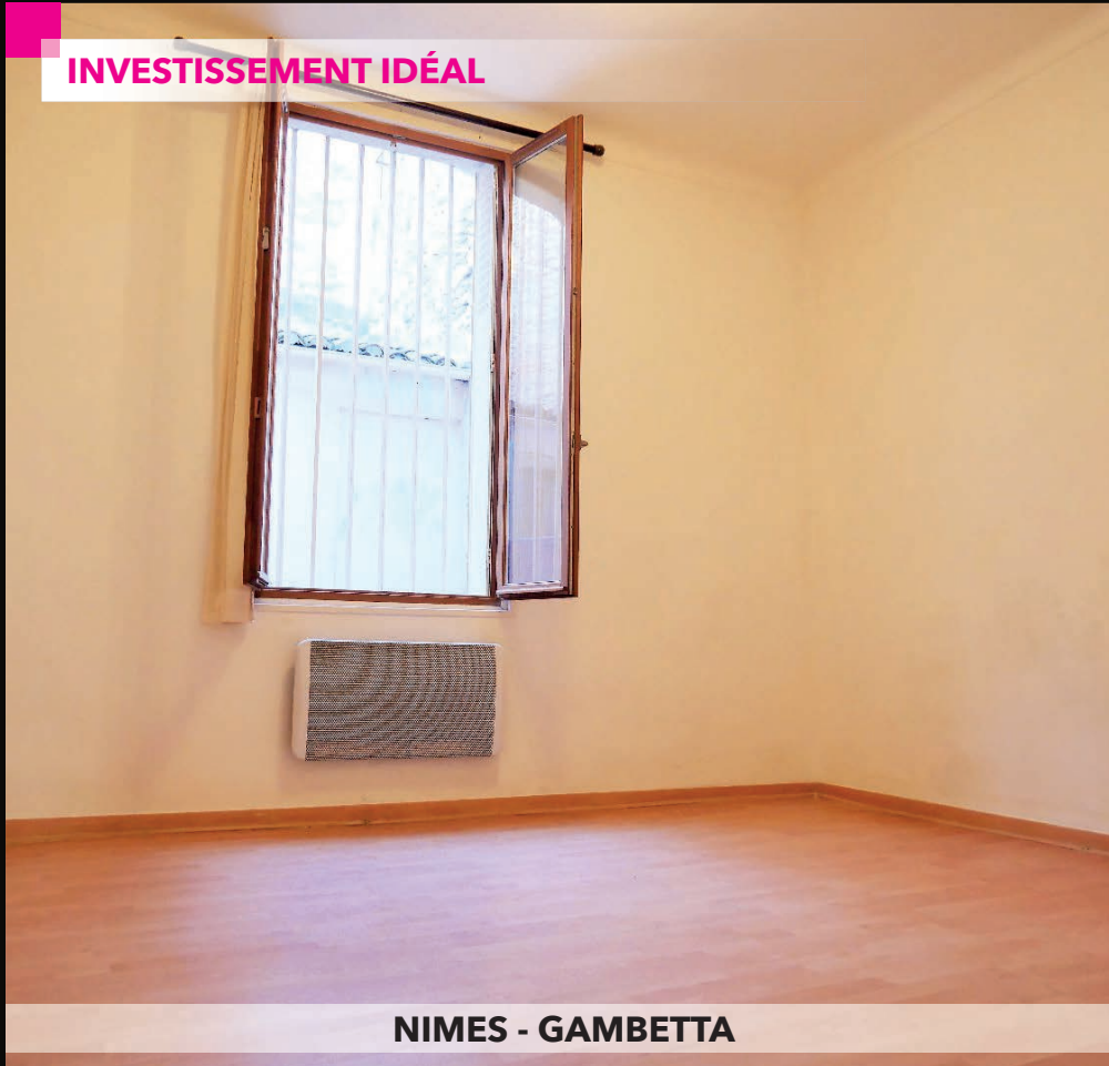
NIMES - GAMBETTA