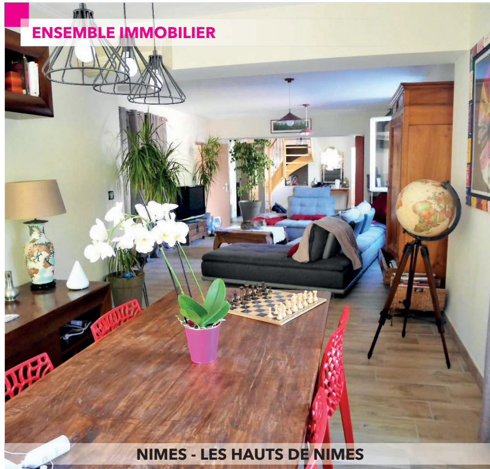
NIMES - LES HAUTS DE NIMES