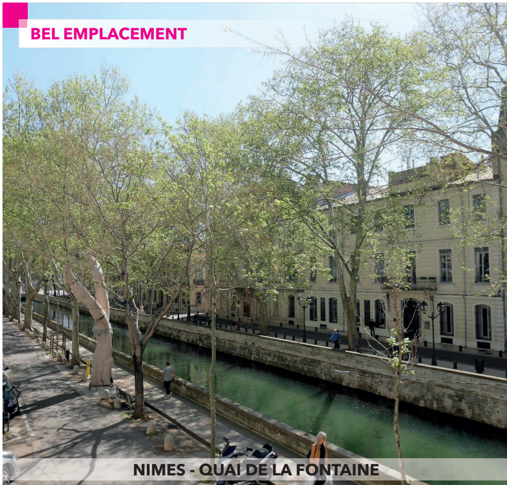
NIMES - QUAI DE LA FONTAINE