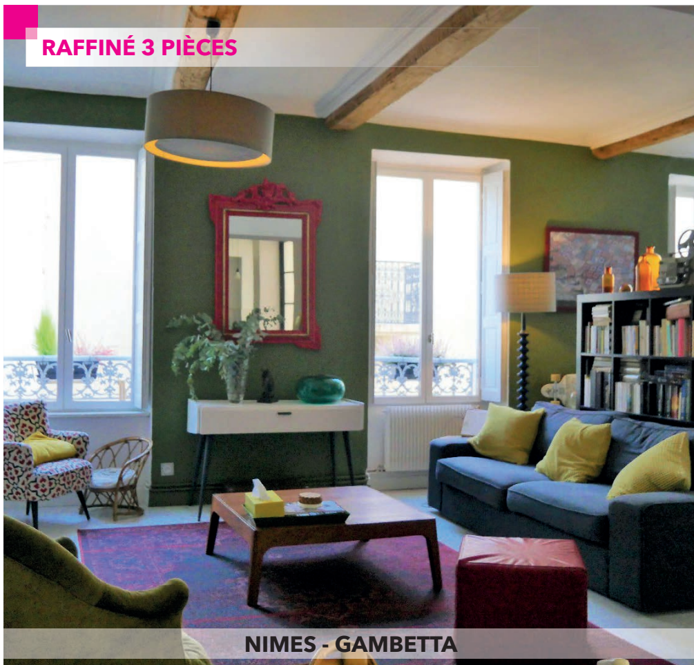
NIMES - GAMBETTA