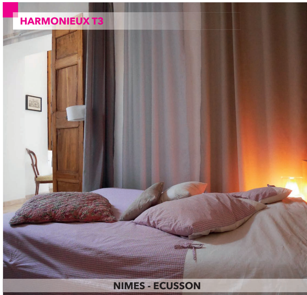
NIMES - ECUSSON