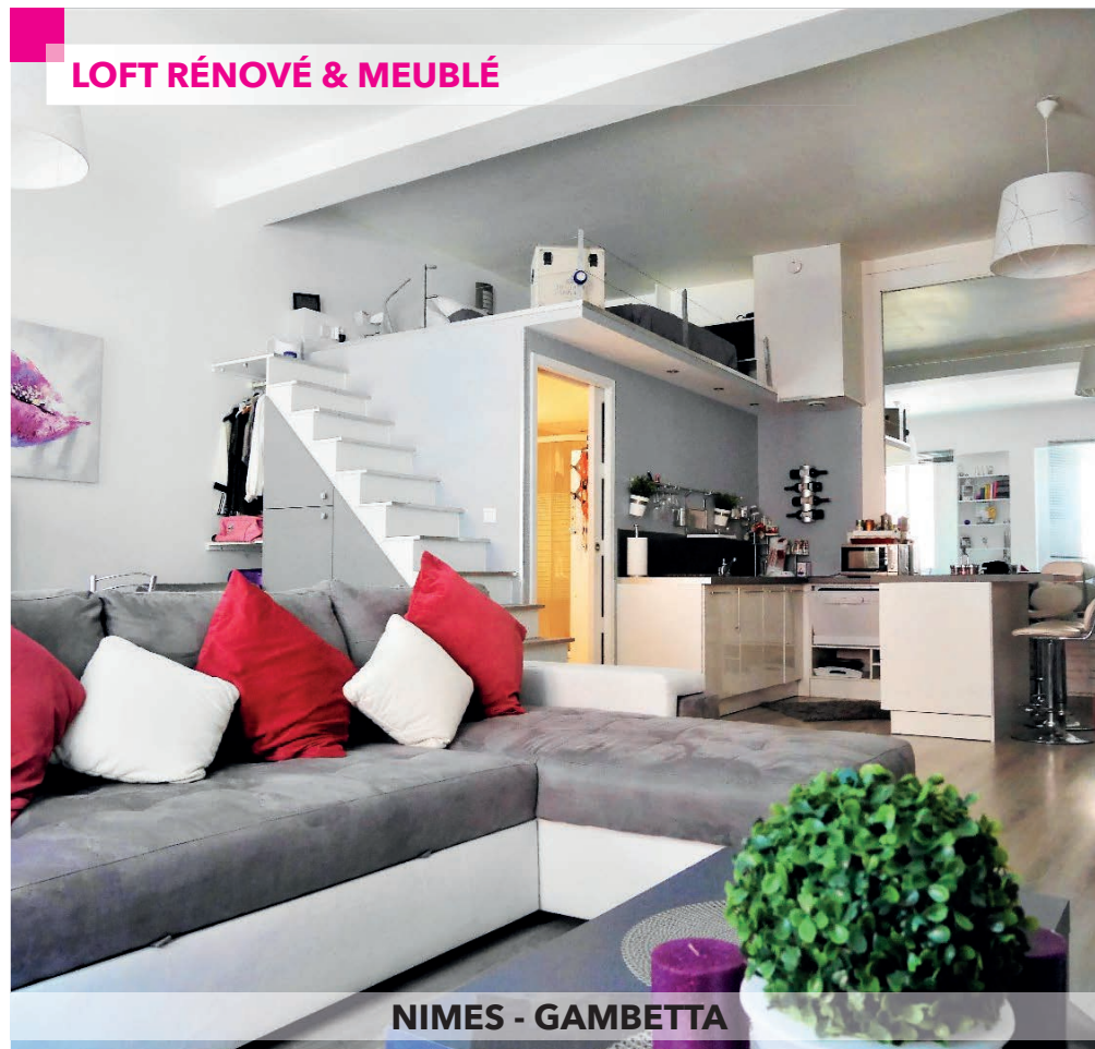
NIMES - GAMBETTA