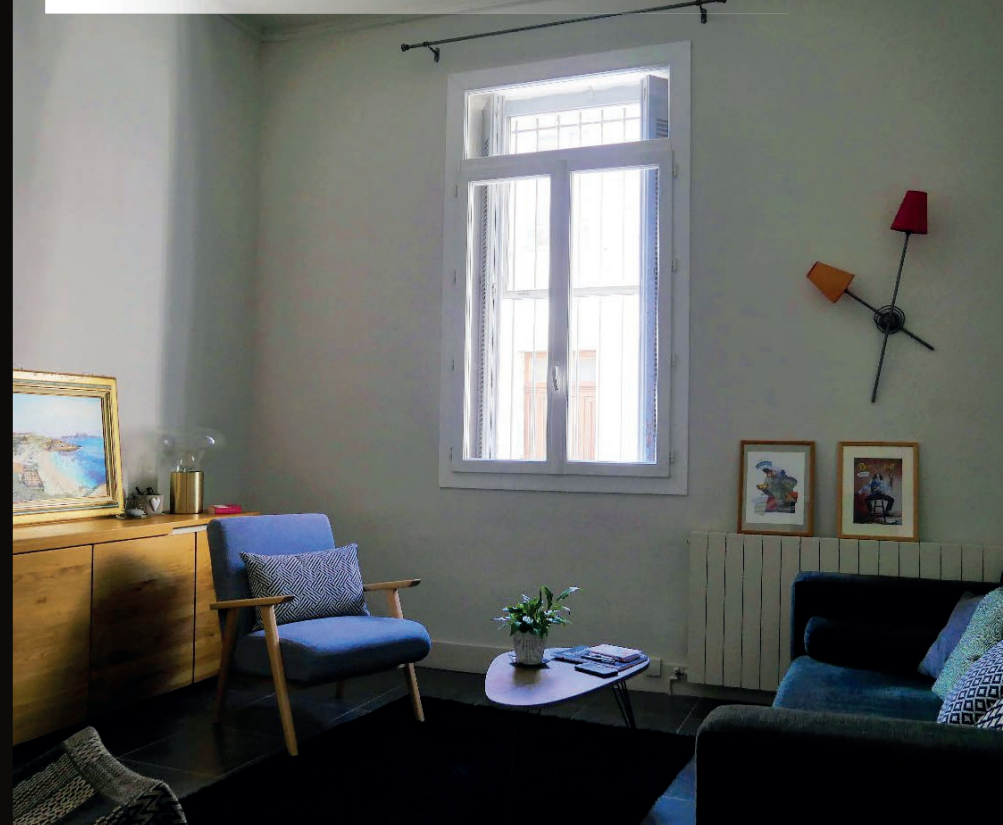
NIMES - MARRONNIERS