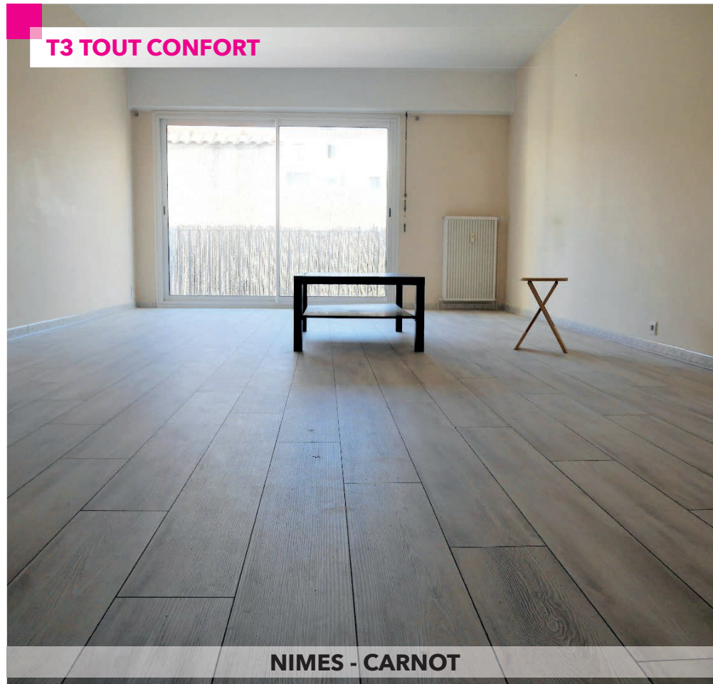
NIMES - CARNOT