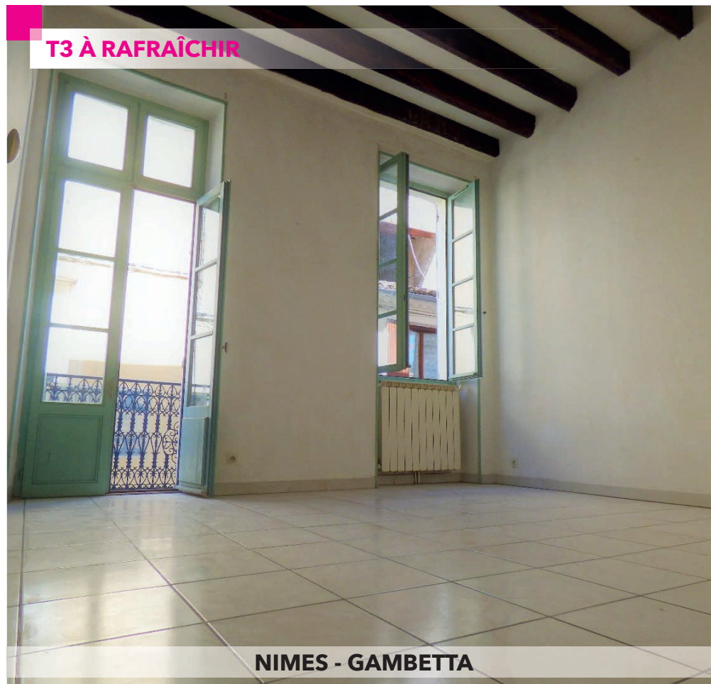
NIMES - GAMBETTA