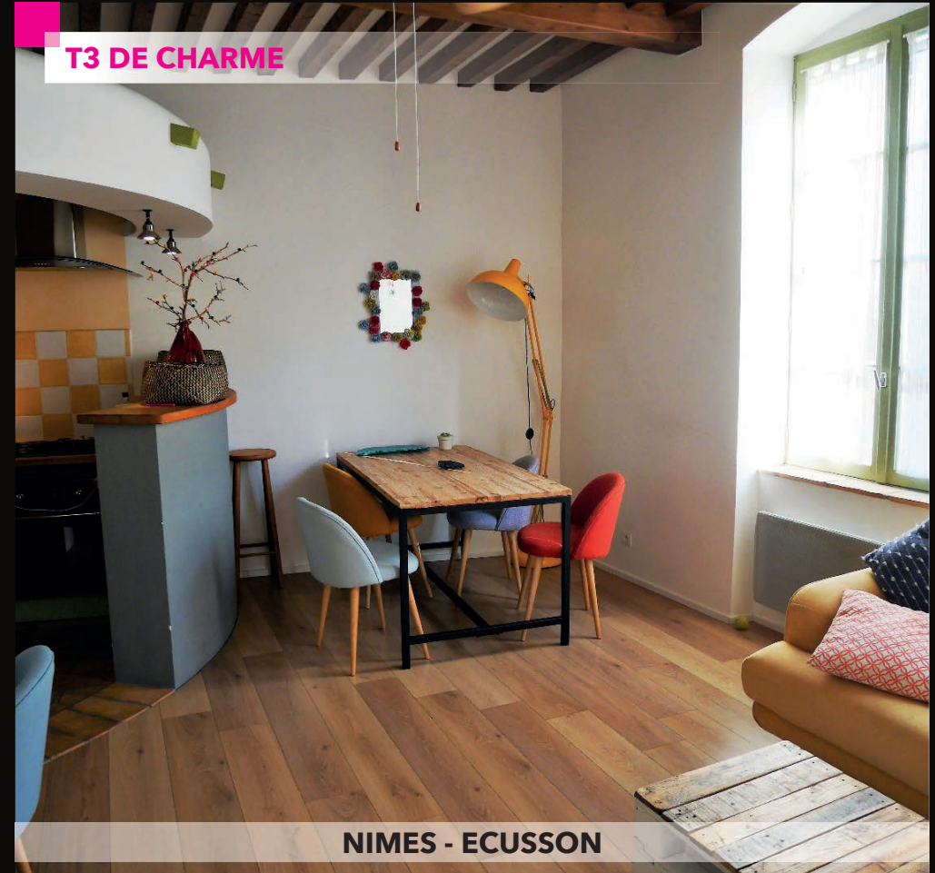
NIMES - ECUSSON