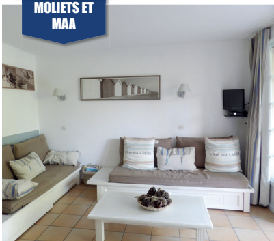
MOLIETS ET MAA