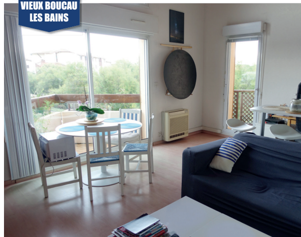
VIEUX BOUCAU LES BAINS